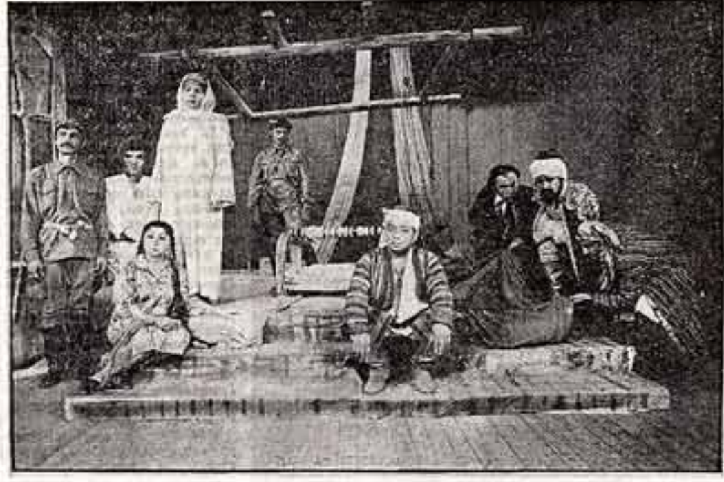
Хорен Абрамян, народный артист СССР.