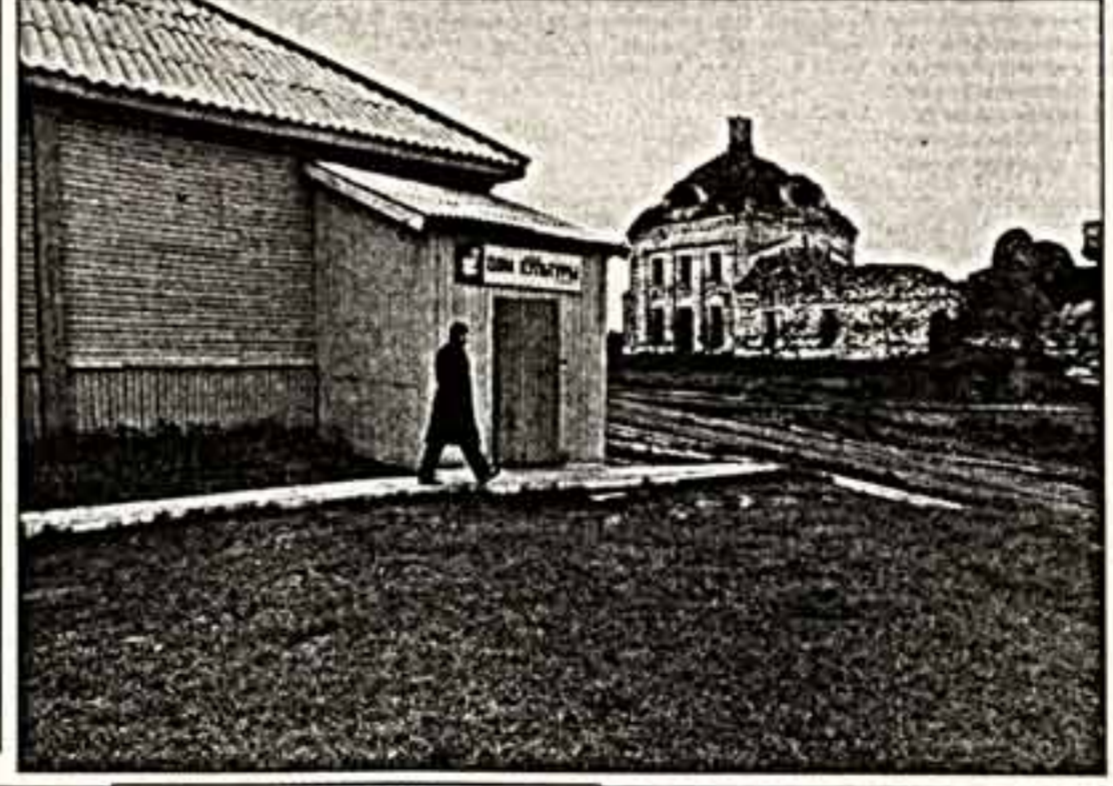
Эта школа — уникальное явление культуры