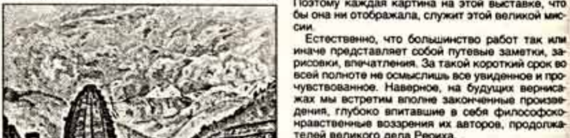
Храм Кришны в Налогре

В залах Российской академии художеств на Пречистенке открылась выставка работ московских художников, участников 5-й гималайской экспедиции, состоявшейся прошлым летом. Ее название «Намасте», что значит — здравствуй. И это доброе приветствие является содержанием, смыслом и символом экспозиции. Здравствуй, долина Кулу (Долина Всех Богов), где жил и работал знаменитый русский художник Николай Константинович Рерих и где в его доме устроен мемориальный музей легендарного мастера Здрравствуй, Индия, ее великий народ, горагора ее, селения и храмы, чудесная природа, Гималаи, столь поэтично воспетые Рерихом!