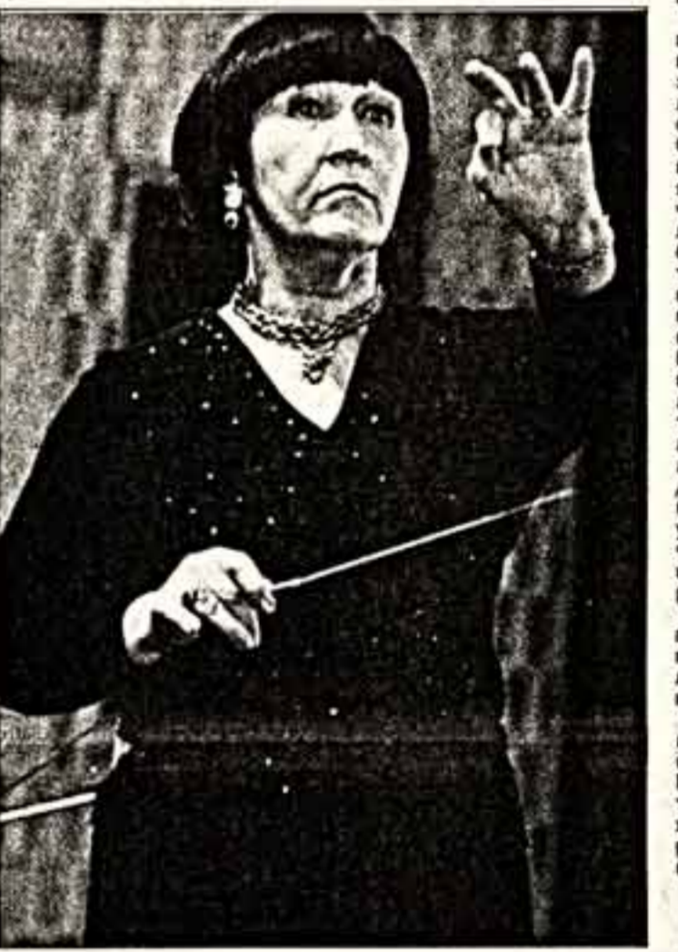
Беседу вела Л.ГУЧМАЗОВА