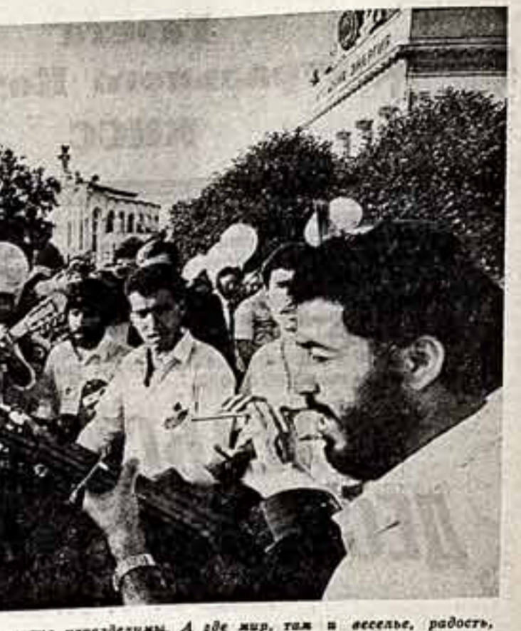
Молодежь и мир — эти понятия неразделимы. А где мир, там и веселье, радость, ласка.