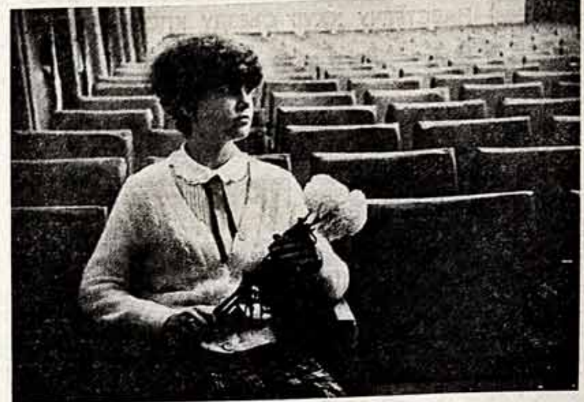
ФОТОКОНКУРС С. БЕЛКОВСКИЙ. «В ожидании кушера».