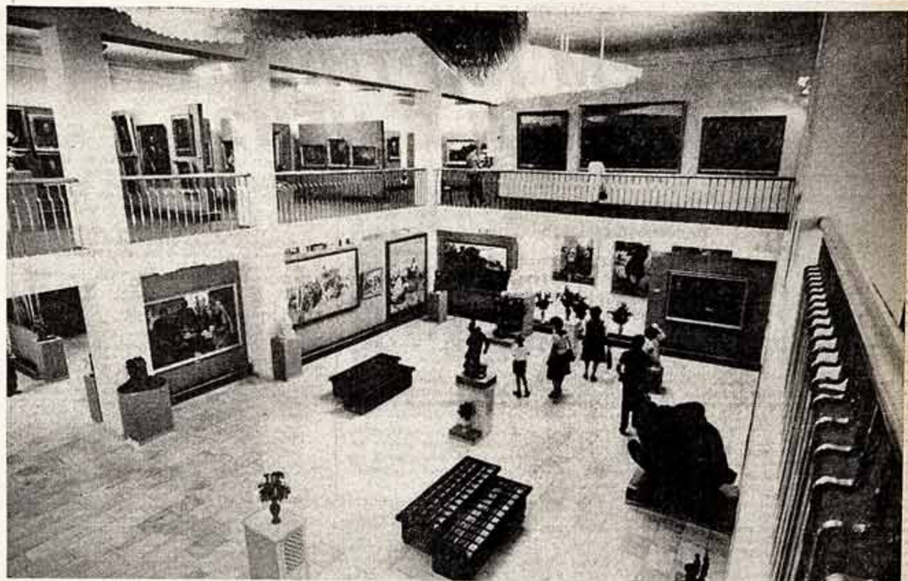
Вот так выглядят областная картинная галерея, недавно распахнувшая двери для любителей изобразительного искусства во Владимире.

Е. ЛУКЬЯНЕНКО, консультант отдела культуры ЦК Компартии Украины, КИЕВ.