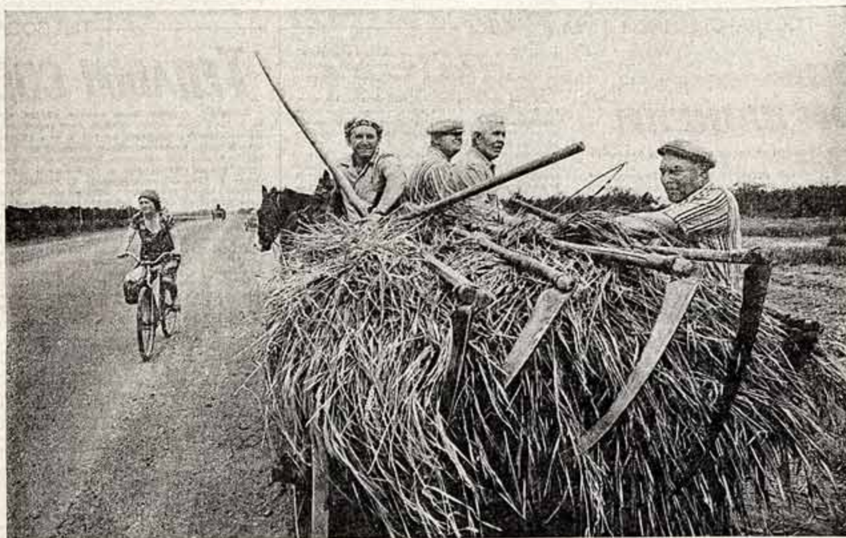
● СЕНОКОС. (В колхозе «Ленинское знамя» Ростовской области).