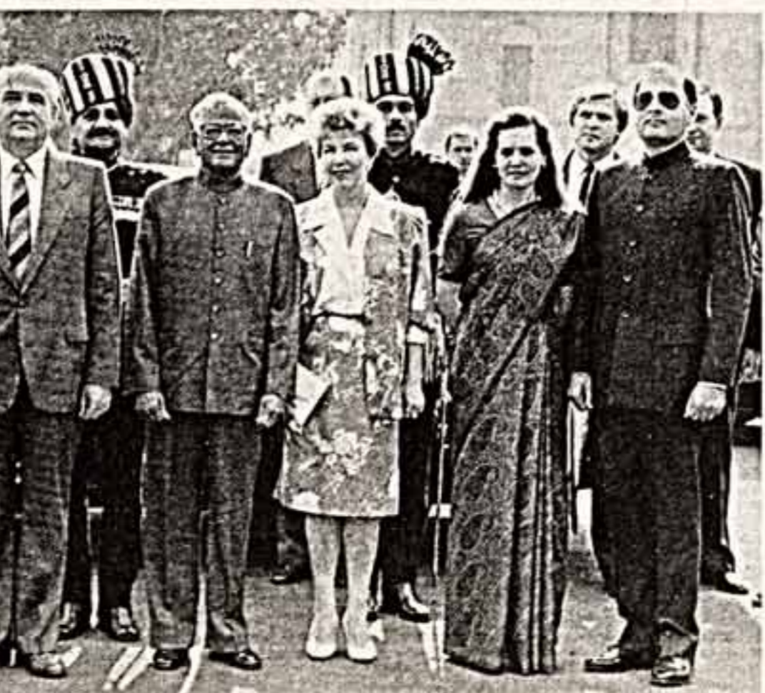
Во время проводов М. С. Горбачева в президентском дворце.

Соглашение между правительством СССР и правительством Республики Индия о сотрудничестве в сооружении второй очереди тепловой электростанции «Виндьячал» на территории Индии.