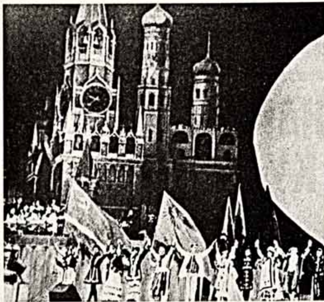
● На закрытии фестиваля СССР в Индии.

Фестиваль закончился, но мы не прощаемся с индийскими друзьями. Мы говорим: «До новых встреч».