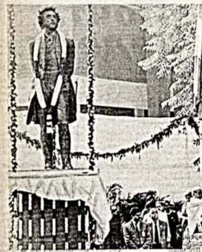
● Открытие памятника А. С. Пушкину в Дели.

ВОРОНЕНКО, С. ПУЗЕВСКИЙ, ШВЕЦ, ШЕРБАК, ВОЯКО, ФИЛИМОНОВА, В. ДАНИЛОВ, артисты: КОЦЮБИНСКИЙ, ЗАВ. ТРУПОЙ: КОНДРАШОВА, ЗАВ. ВИДЕО: Ю. ОЛЕЯНИК, ЗАВ. МУЗ. ЧАСТЬЮ: Г. ДИКО, ИЩЕНКО, КОСТЮМЕРЫ: Т. ИГНАШКИНА. Остальные подписи неразборчивы.