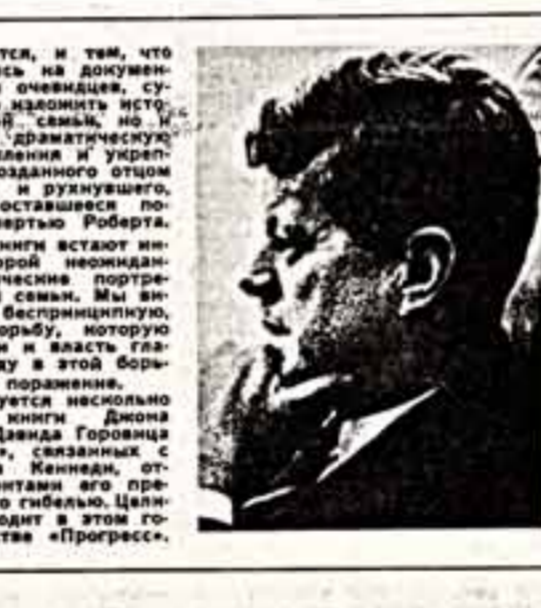
Джон Ф. Кеннеди.