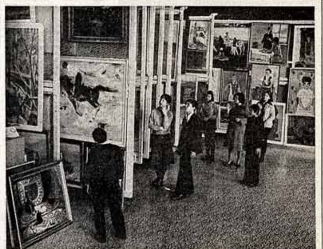
В Государственном музее изобразительных искусств Казахстана начал работу университет изобразительного искусства для школьников.