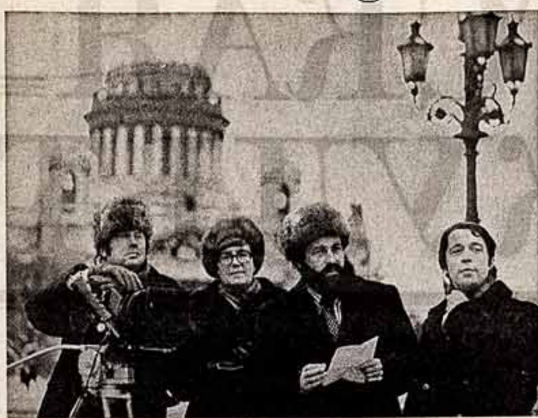
Ленинград. Промышленный гигант на Каже и трасса ВАМа, нефтепромыслы Самолора и ледоход дорота «Арктика», хозбазы Ичирозельск и Оренбургск, ведущие борьбу за урожай... Документалисты — оператор Ю. Александров, режиссеры И. Калинин, М. Литавков и оператор М. Массе.

«Советская культура» приглашает секретарей первичных партийных организаций, коммунистов творческих союзов, театров, музеев, филармоний, учебных заведений искусства и культуры поделиться на страницах газеты опытом работы.