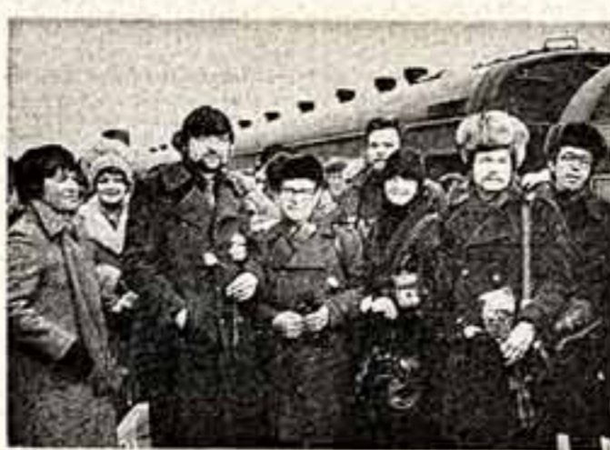
Общественность Москвы тепло приветствовала делегацию работников культуры Финляндии. Встреча на Ленинградском вокзале.

С большим интересом финские артисты, художники, певцы идут встреч со своими советскими коллегами; к замечательному искусству нашей страны мы отнеслись с уважением и искренней симпатией. В коммуналке по случаю визита в СССР президента У. Кекоконе было подчеркнуто, что развитие советско-финляндских отношений за последние десятилетия стало ярким примером воплощения в жизнь принципов мирного сосуществования государств с различными социальными системами. — Первые Дни финской рабочей культуры в СССР — еще одно подтверждение справедливости этих слов, — сказал в заключение Т. Бергхолм, — и мы надеемся, что проведение таких встреч станет традиционным. Договор о дружбе, сотрудничестве, взаимной помощи, существующий между нашими странами, дает возможность для самых широких контактов в области культуры.