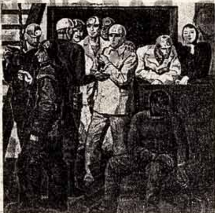
Широкий творческий диапазон работ художников Украины, представленных в Центральном выставочном зале Москвы. Перед нами экспонаты трех разделов: скульптуры, живописи, графики.