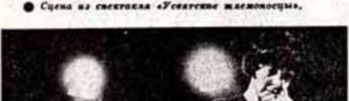
Спектакль идет в постановке А. Вышняка, оформил художник В. Белов.