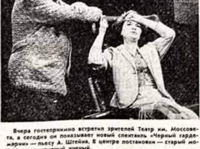
Сцена из спектакля «Черный гардерник».