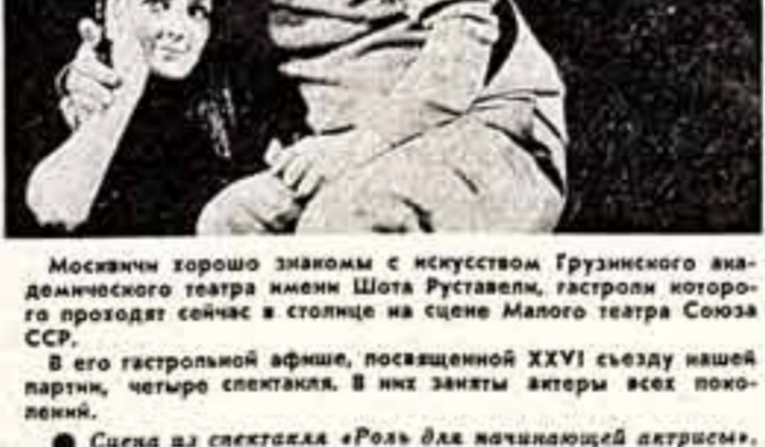
Сцена из спектакля «Роль для начинающей актрисы».