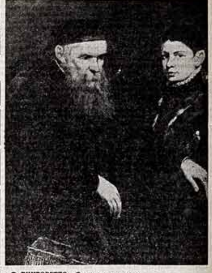
Тинторетто. «Старик в мальчике».

Тициан, Тинторетто, Веласкес. Три великих имени, три холста с выставки Венского музея истории искусства, привезенной в Москву. У входа в Государственный музей изобразительных искусств, где развернута выставка, — нескончаемая очередь: уже не первый раз привозят из прославленных зарубежных собраний полотна мастеров прошлого, и каждая новая встреча несет с собой впечатление глубины и силы. ...Какое бы, какое нам дело до того, что испанскую инфанту Маргариту Терезу в раннем детстве прославили в жениху будущему австрийскому императору Леопольду, и мадридский двор посылал в Вену портреты инфанты, а в пятнадцатилетнем возрасте она была выдана замуж за Леопольда, а двадцати двух лет она была убитая Веласкесом. Остановлен навеки облик этой золотоволосой девочки, одетой не по ее детским годам в парчу и дорогое шитье, и, право, ценностью не в пример больше, нежели династическая связь Мадрида и Вены, ценностью вечной, непреходящей выступает волшебство письма серебрянкой порчи с ударяем черного и красного и темного темного-красного бархата драпировки. И вневность, обаяние детского лица, золотого волос на черном глубоком фоне — как все это немыслимо красиво той красотой, которая идет через века и страны и тревожит нас прикосновением к таинству величайшей на свете живописи.