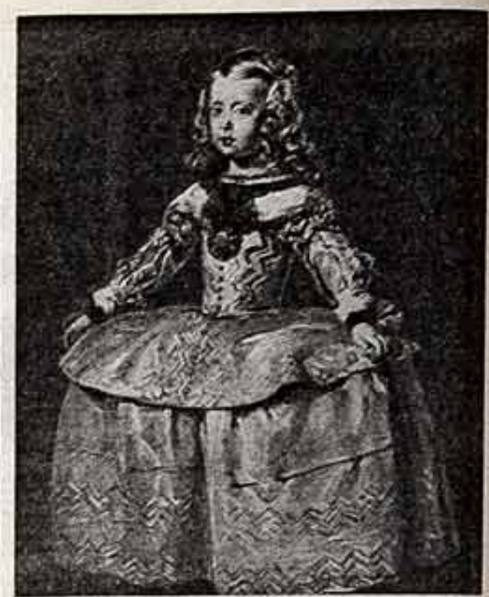
Веласкес. «Имфанта Маргарита Тереса в белом платье».

жею такую яростную реакцию, что дело доходит до дипломатических протестов. Однако английская пресса перепечатала из «Известий» его блестящую карикатуру, на которой тогдашний британский премьер Остин Чемберлен, заданный антикоммунист и антисоветчик, опознал себя среди других персонажей, изображенных художником, хотя он и не был должным образом обозначен. Британское министерство иностранных дел прислало Советскому правительству ноту протеста. Ответом на нее послужил саркастический фельетон Михаила Кольцова в «Правде». Обинаясь на Бориса Ефимова и государственного секретаря США А. Дж. Уэллса, выразивший свой протест против того, что карикатура на него была помещена на первой странице «Известий». А критиковать его, как и Чемберлена, было за что — он остроно противник коммунизма и коммунистическому движению. Но мы бы не установились в отношении к «большим» странам. Ну что ж, тут как раз подошел новый 1924 год: в ту пору нас начали признавать одна капиталистическая страна за другой, и в новомодном номере «Известий» на первой полосе была помещена новая огромная карикатура Бориса Ефимова: на ней был изображен прорывающийся через первую страницу газет Новый год в виде озорного мальчишки в иппе, держащего в руках свиток признаний СССР, а внизу — устремленный Юл. Подпись гласила, что «ввиду особого интереса, который Юл представляет к первой странице «Известий», в настоящем номере его отомечает своей восьмидесятью