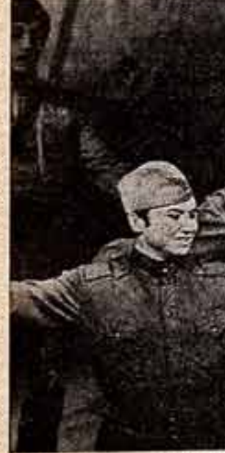
Сцена из спектакля «Василий Теркин».

Интересно задумали новый спектакль Свердловского театра музыкальной комедии «Василий Теркин» режиссер В. Курочкин, композитор А. Новиков (либретто П. Градова). Это оперетта-песня (авторы так и обозначили ее жанр). Свердловчане в своей постановке мажут не от бытовой достоверности песни, а от ее образности, эмоционального строя. Отсюда стремление к поэтической образности, поэтической символике. Главное для театра — не столько воссоздать на сцене конкретную фигуру, рассказать