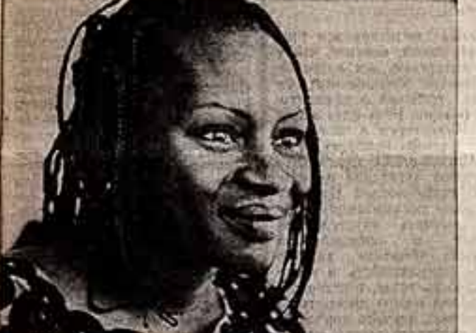
Актриса театра и кино из Сенегала Фатима Диана впервые в Москве.