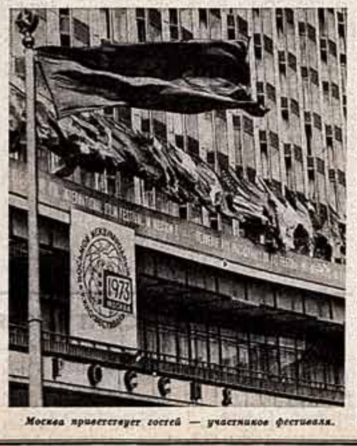
Москва приветствует гостей — участников фестиваля.

Итак, столица Советского Союза — наша Москва в восьмой раз становится кинематографической столицей мира. В этот раз и прежде всего — о москвичах. С полным основанием в Москву утверждать, что она очень большие поклонники киноискусства. У подножия наших кинотеатров всегда очень оживленно. Часто можно услышать традиционные: «Нет ли лишнего билетика!»