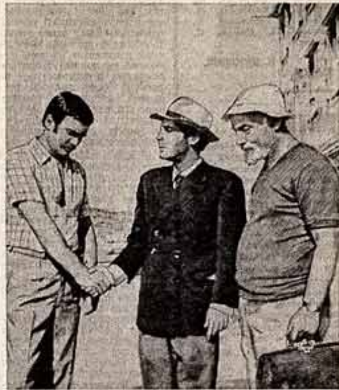
БОРИС ДВОРНИК И ЕГО ГОСТИ

Популярного югославского артиста Бориса Дворника Популярного югославского артиста Бориса Дворника Популярного югославского артиста Бориса Дворника