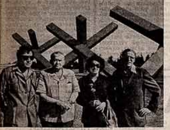
Группа гостей из Югославии: член жюри конкурса детских фильмов режиссер Ф. Штилиц с супругой, режиссер Жика Ристица и актер Истреф Ведица у памятника защитникам Москвы на Ленинградском шоссе.