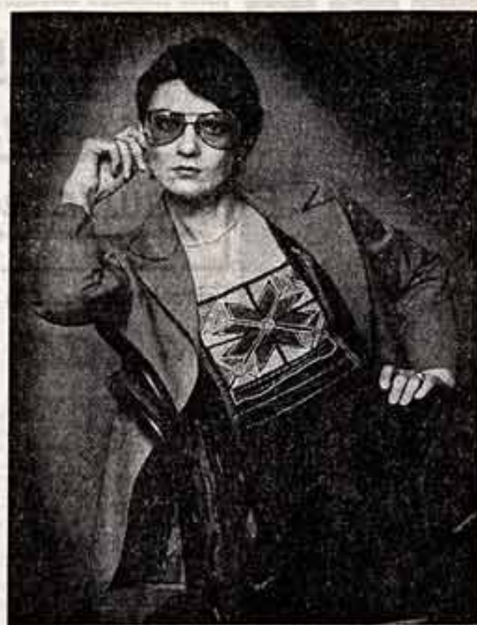
Эмиль ПОТЯНУ, народный артист РСФСР

И оттого, что теме войны, военному подвигу здесь, на выставке, посвящено так много работ, ощущается звучит образ мира, справедливости, гуманизма.