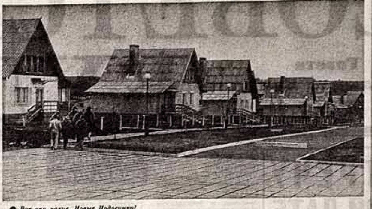
Вот они как-то, Новые Подосинки!