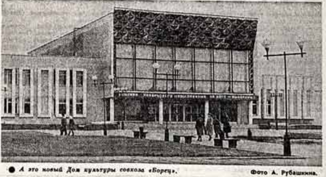
А это новый Дом культуры совхоза «Борец».