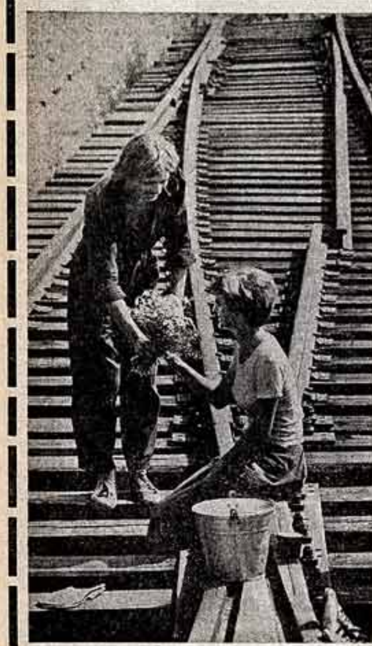
Всего — пора цветов.