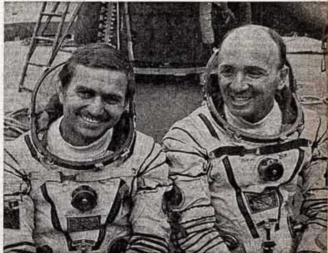
Экипаж космического корабля «Союз Т-5». Командир экипажа А. Н. Березовый (слева) и бортинженер-летчик-космонавт СССР В. В. Лебедев.

Воротные системы корабля «Союз Т-5» работают нормально. Самочувствие космонавтов Березового и Лебедева хорошее.