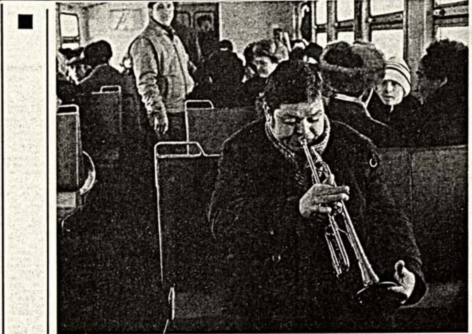
...А человек играет на трубе.