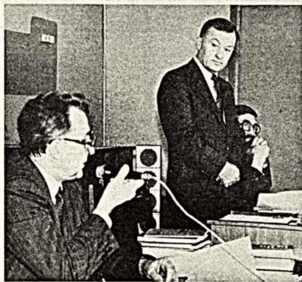
Официальная записка А. ГАСПАРИ.