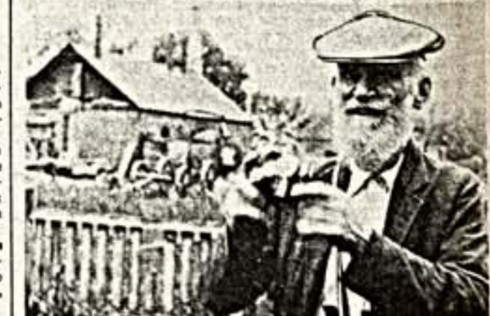
Ю. ЖДАНОВ, МОСКВА.

Мы предлагаем вашему вниманию уникальные фотографии. Редкие, забытые, нигде не публиковавшиеся кадры запечатлели знаменитых людей, памятные события, исторические встречи. Правильные отгадки будут «открыты» 10 очко, правильный ответ — 15. Победители будут опубликованы и прославлены. Первая попытка. Угадайте, кто этот симпатичный старичок и что он делает в танкобонном холосте?