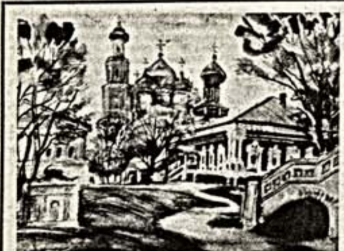
АКВАРЕЛИ АНАТОЛИЯ КОСОВОГО