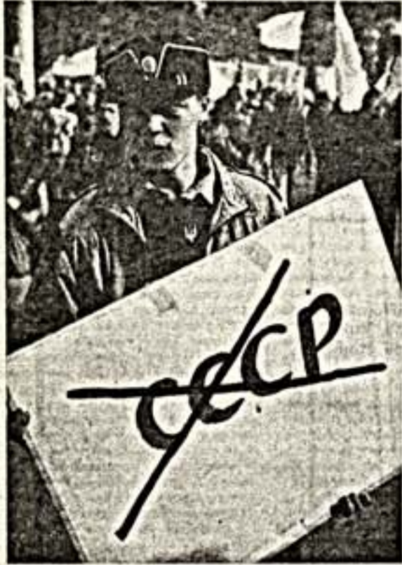
В эти дни на улицах Киева.