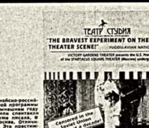
THE BRAVEST EXPERIMENT ON THE SOVIET THEATRE SCENE!