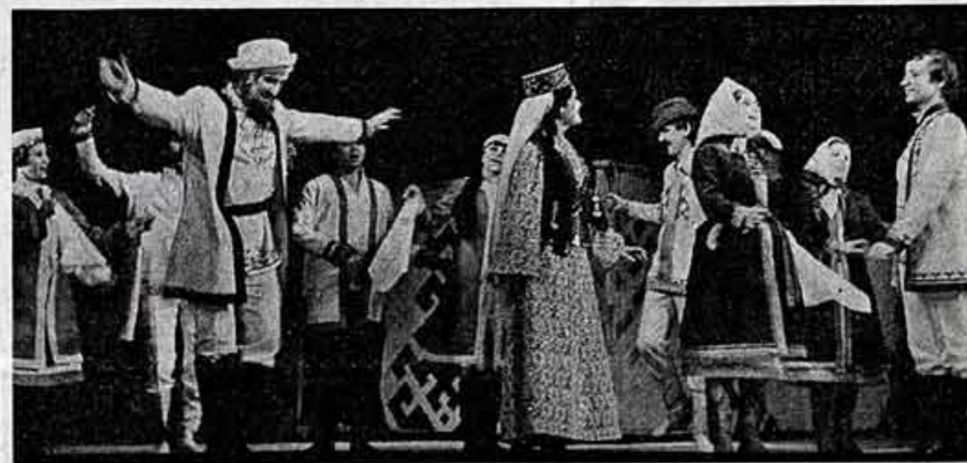
Государственный музыкальный театр Марийской АССР поздравил воинов-ветеранов и гостей столицы автономной республики со своей новой работой — мюзиклом «Марийский сувенир»...