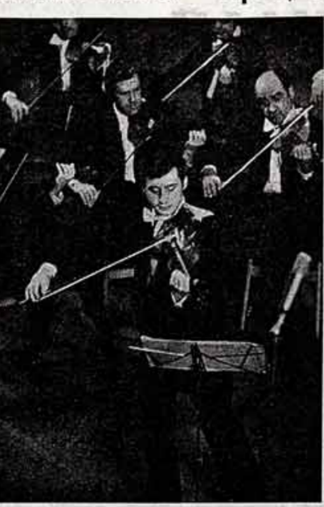
Выступают «Виртуозы Москвы». Сolist В. Спиваков.