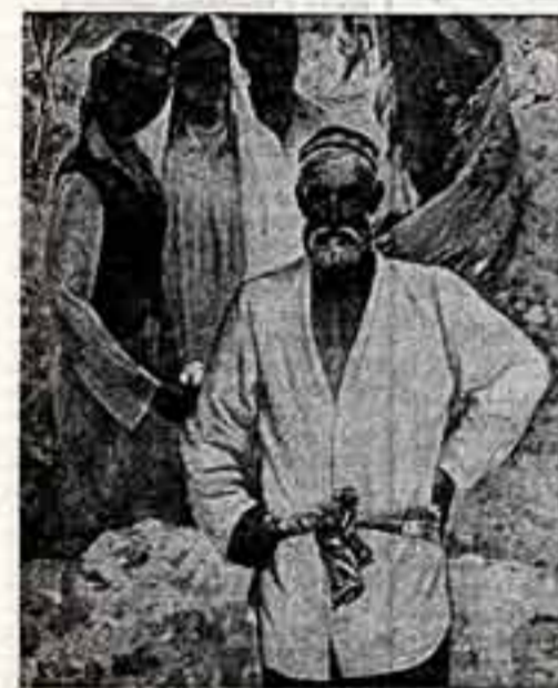
Романтика в ее самых разных гранях и оттенках — волнующая, зовущая, таинственная... Обширную серию портретов людей труда и творческой интеллигенции создал И. Ли...