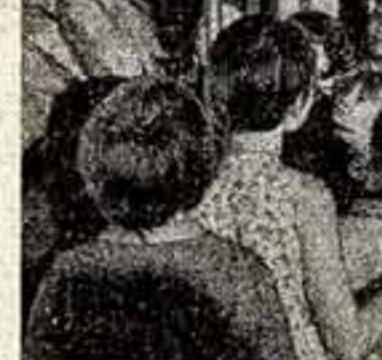
Елка в театре

Хор вырос в большой творческий коллектив, в котором работают свои поэты и создается музыкальный ансамбль по всей стране. Так сочинения композитора Максимилиана Глинка, руководителем хора со дня его основания, составляют значительную часть репертуара коронных гастролеров за рубежом.