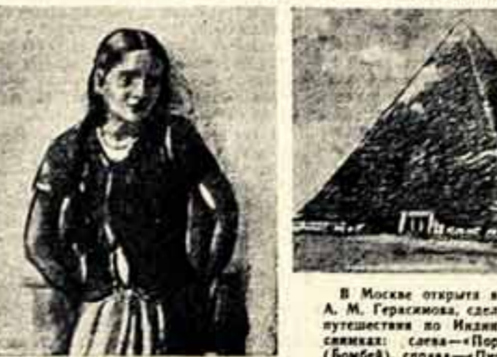
В Москве открыта выставка этюдов А. М. Герасимова, сделанных во время путешествия по Индии и Египту. На слайках: слева — Портрет девочки (Бомбей), справа — Пирамида Хеопса.

В районных домах культуры и сельских клубах артисты регулярно проводят с участниками художественной самодеятельности беседы, читают лекции о постановке спектаклей и подготовке концертных номеров. Для передовых бригад устраиваются концерты.