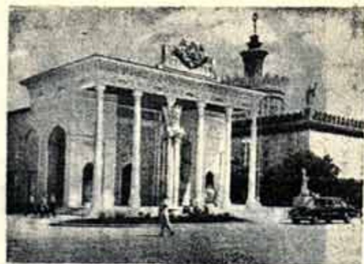
Всесоюзная сельскохозяйственная выставка. Слева — павильон Туранской ССР, справа — павильон «Волное хозяйство».