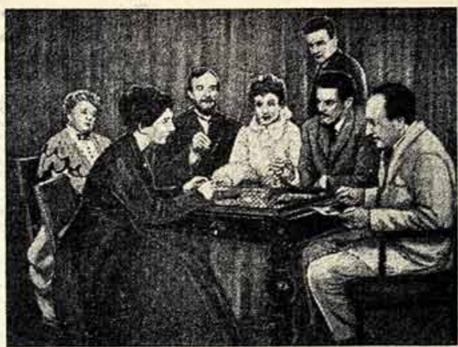
Нью-Йоркский корреспондент английского театрального журнала «Тител уорлд» сообщает, что бродвейский театр «Феникс» поставил в этом году пьесу А. П. Чехова «Чайка». По словам корреспондента, американская публика проявила большой интерес к постановке этой чеховской пьесы в США. В этой связи театральные специалисты обращают внимание на то, что к постановке пьес великого русского драматурга следует относиться с повышенной требовательностью. (Соб. инф.)

КОПЕНГАГЕН. (ТАСС). В копенгагенском кинотеатре «Риальто» с большим успехом демонстрируется советский кинофильм «Колоски мастера искусства», в котором выделены отдельные кадры из кинофильма «Мастера украинского искусства». Газеты в своих рецензиях отмечают высокое мастерство советских артистов.