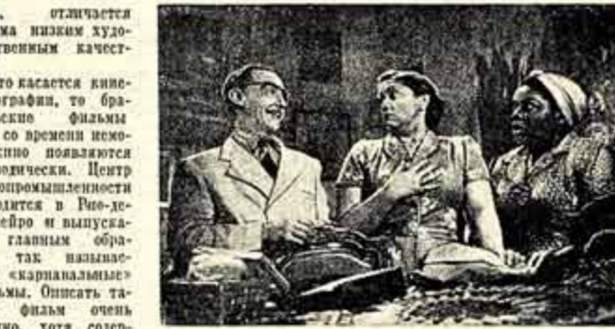
Кадр из бразильской кинокомедии «Кривой Симон» (режиссер А. Кавальканти).

В скульптуре также чувствуется формалистические тенденции, но в меньшей степени. Среди скульпторов следует назвать Виктора Брешерета и Бруно Жюрды. Недавно в Сан-Пауло и сейчас в 400-летнем городе был открыт памятник, созданный Брешеретом. Эта скульптура изображает