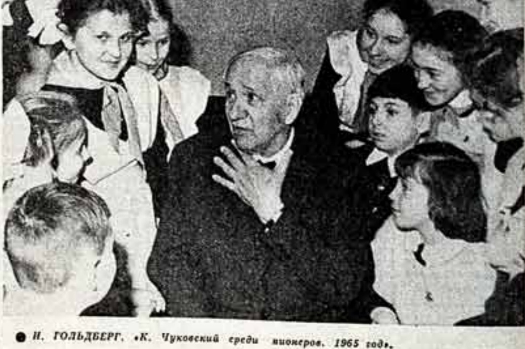
Н. ГОЛЬДБЕРГ. «К. Чуковский среди школьников, 1965 год»