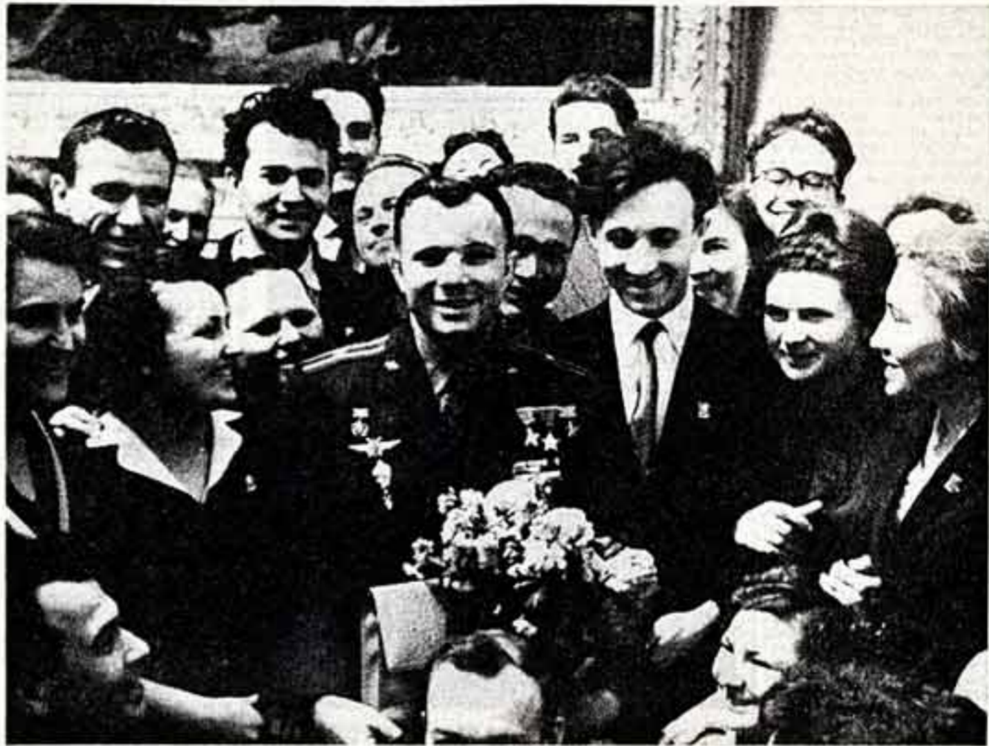
Юрий Алексеевич Гагарин среди делегатов XV съезда ВЛКСМ.