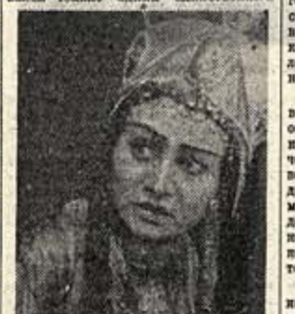
Народная артистка Союза ССР орденноноска Кулиш Байсентова в роли Аджуну.

последовательно развил свои принципы обработки народной музыки.