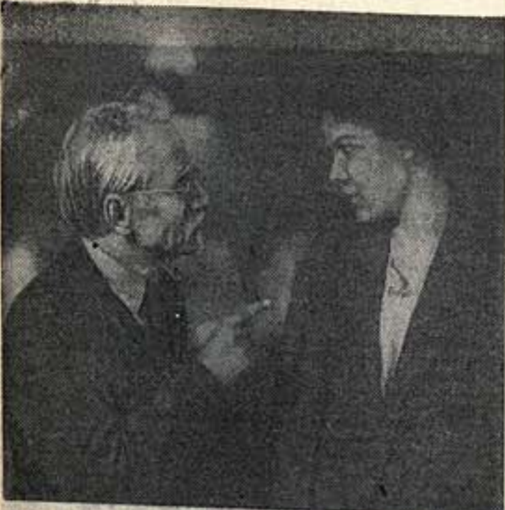
Кадры из фильма «Возвращение Максима».