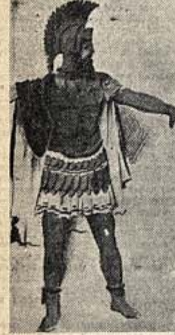
В музыкальном театре им. Наринчи-Данченко идут спектакли «Прекрасная Елена»...