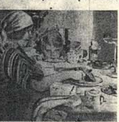
Котов. «Моя семья. Завтрак».