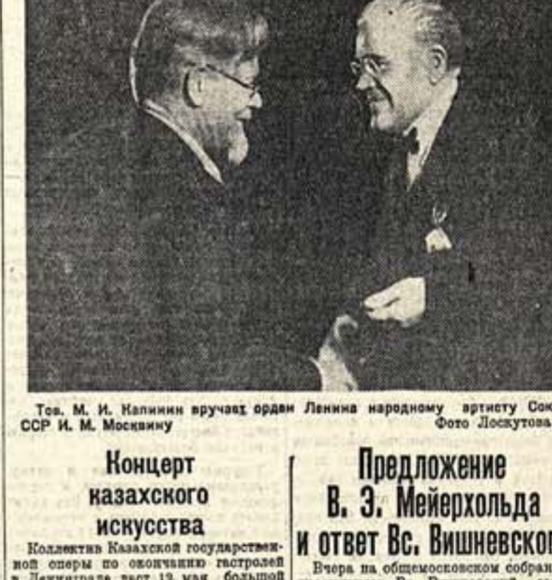
Тов. М. И. Калинин вручал орден Ленина народному артисту Союза ССР И. М. Москвину