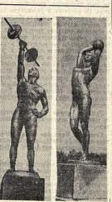
Скульптурные фигуры «Гириван-