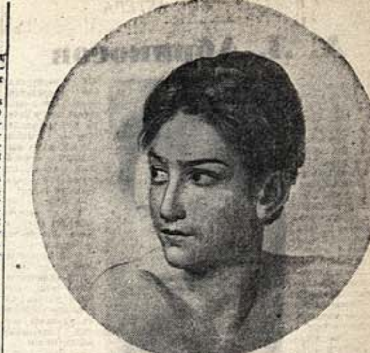
Александр Иванов. «Голова итальянского мальчика». Картина приобретена Всесоюзным комитетом по делам искусства.