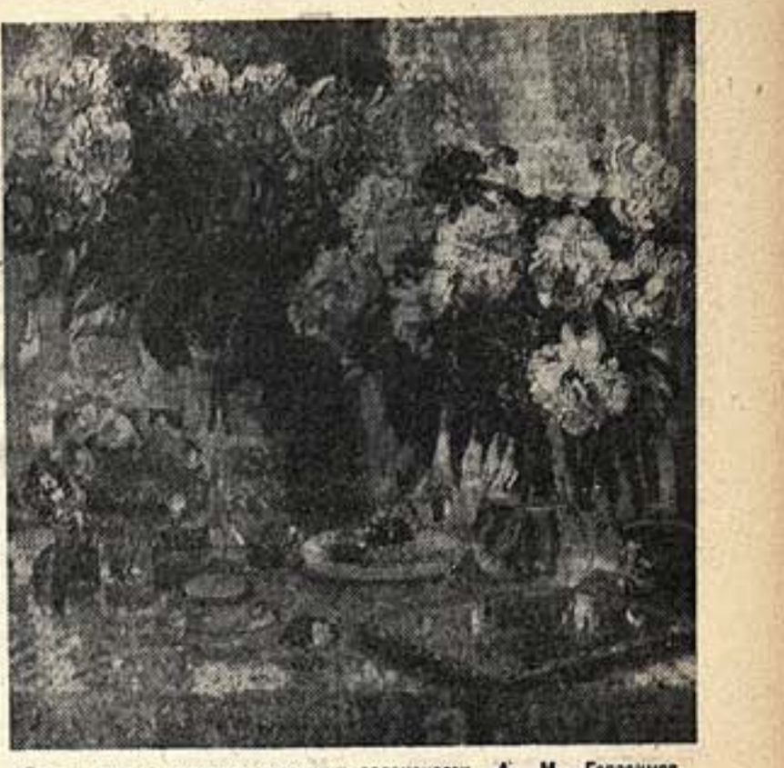
Засл. деятель искусств художник-орденоносец А. М. Герасимов.