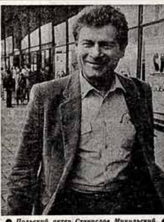
Польский актер Станислав Микальский.

Беседы вел Е. ТУРУБАРА, Е. ЕРМАКОВА, В. ЖЕЛТКОВА.