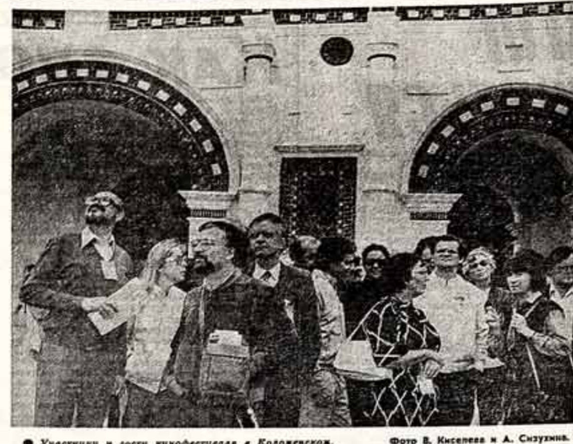
Участники и гости кинофестиваля в Колодежском.