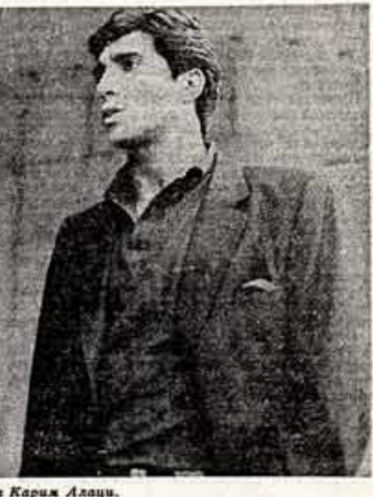
Актер из Туниса Карам Алави.