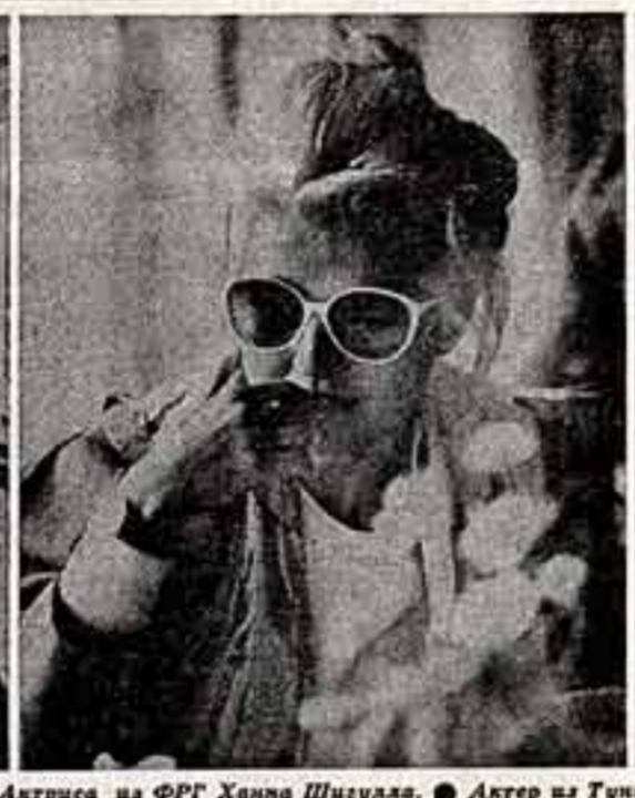
Актриса из ФРГ Ханна Шулца.