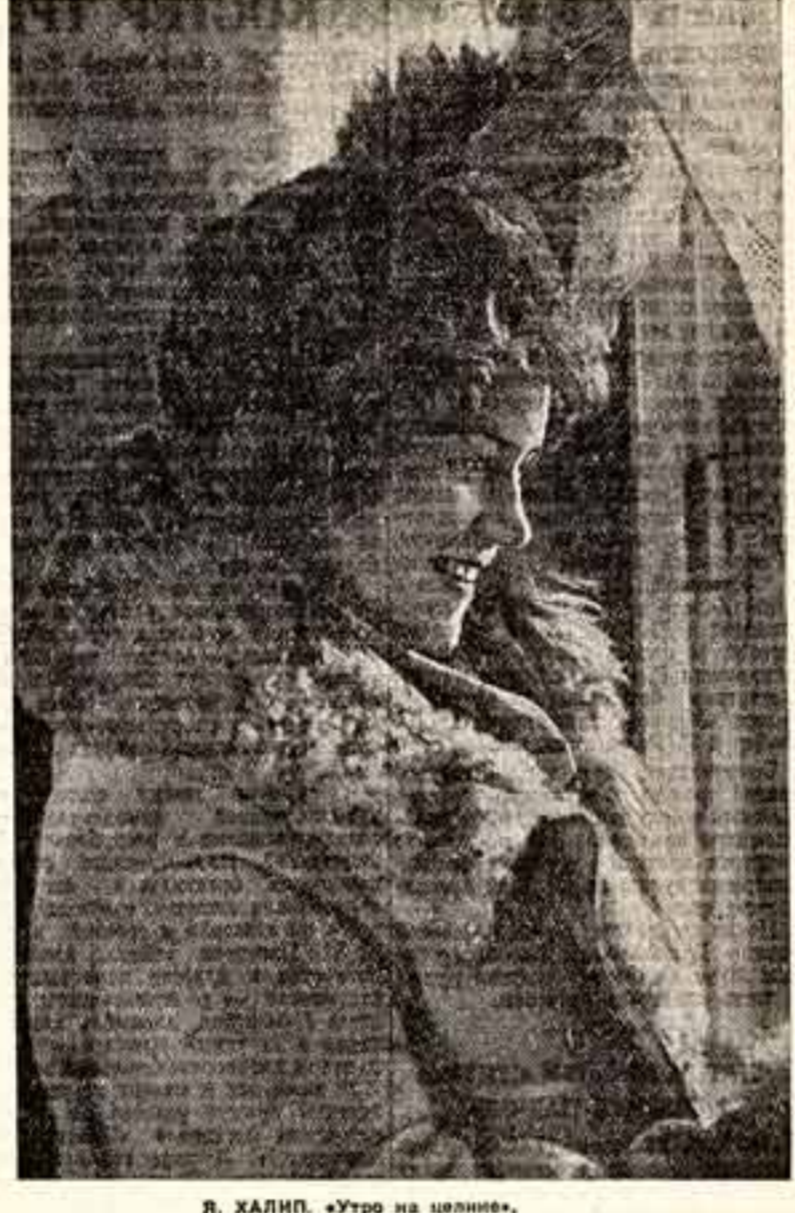
Я. ХАЛИП. «Утро на целине».

Владимир Ильич Ленин на заре нашего государства говорил, что искусство принадлежит народу, и оно должно уходить своими глубочайшими корнями в самую толщу широких трудящихся масс. Как это верно и хорошо сказано! Слова эти облегли для меня в плоть и кровь.