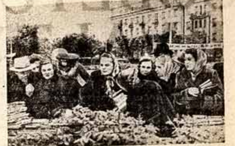
Уважаемый товарищ редактор! В Кирове открылся книжный базар, и мне захотелось снять на пленку его уголок. Послал вам снимок, — может, он покажется вам интересным для опубликования.

Мы знаем, какое внимание придает партия и правительство подвигу сельского хозяйства, простому колхозному деревню. Колхозное производство является сейчас в более высокую фазу своего развития, ведущего к изобилию, к повышению жизненного уровня советского народа.