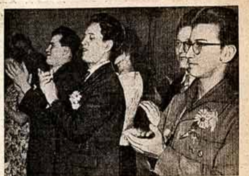
Делегаты немецкого «Поезда дружбы» на молодом балу в Центральном доме культуры воспитанников трудовых резервов.