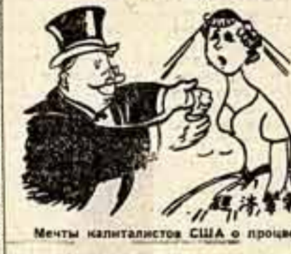
Мечты капиталистов США о процветании... и действительности. Рисунок художника Чэнь И-Фаня.