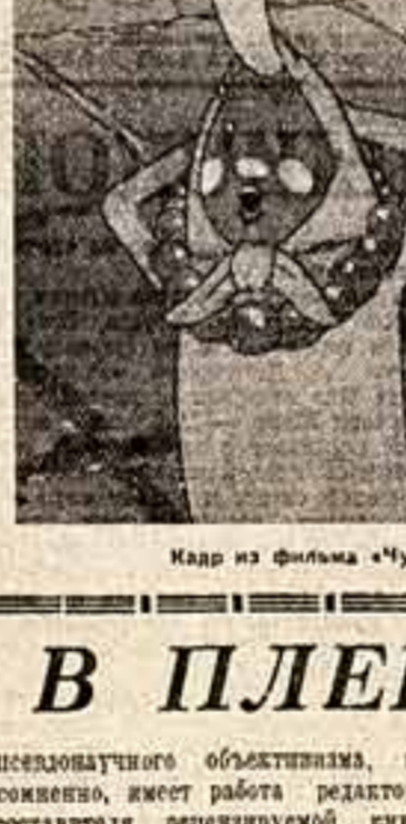
Кадр из фильма «Шофер поневоле».

На днях в Центральном доме журналиста Министрство культуры СССР организовало просмотр новой цветной кинокомедии «Шофер поневоле», созданной на киностудии «Ленфильм».