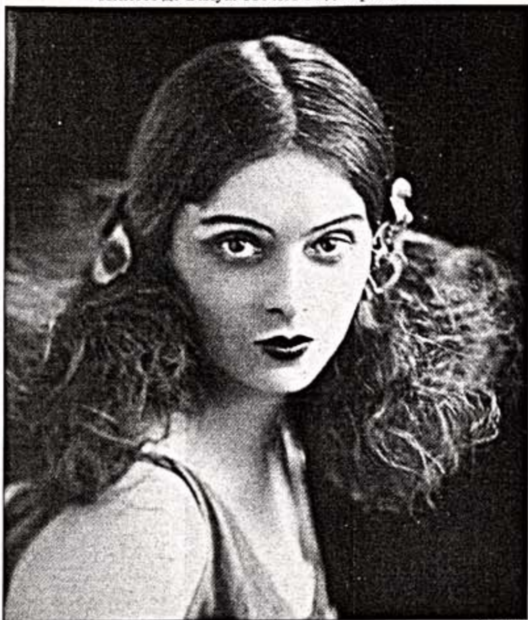
Н. де Валуа

Нинетт де Валуа. 110 лет со дня рождения