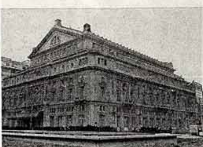
имени Христофора Колумба, в котором не раз выступали советские артисты и музыканты. ● Памятник основателю Буэнос-Айреса, испанскому конкистадору Педро де Мендоса. ● Театр оперы и балета имени Христофора Колумба. ● Памятник Колумбу в парке имени Колумба.