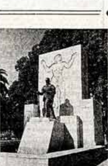
Среди городов Латинской Америки Буэнос-Айрес славится своими широкими проспектами, обширными парками, просторными площадями, множеством памятников. В официальном справочнике-гаде их около двухсот, но перечислить все не все, а только те, которые представляют особую художественную ценность. В городе имеется Театр оперы и балета