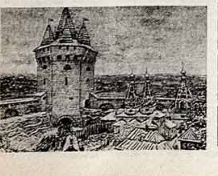
Музей-квартира Аполлинария Михайловича Васнецова