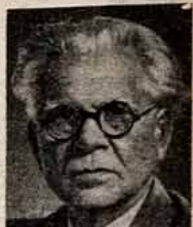
Федор Васильевич Гладков в своей разносторонней, неутомимой общественной деятельности...