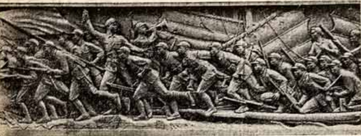
Лю Кай-шю. «Победная переправа через Янцзы». Барельеф.