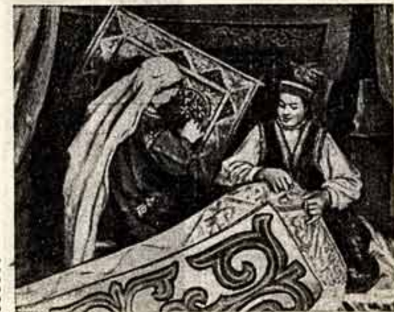
М. Цултам. «Новорожденный».