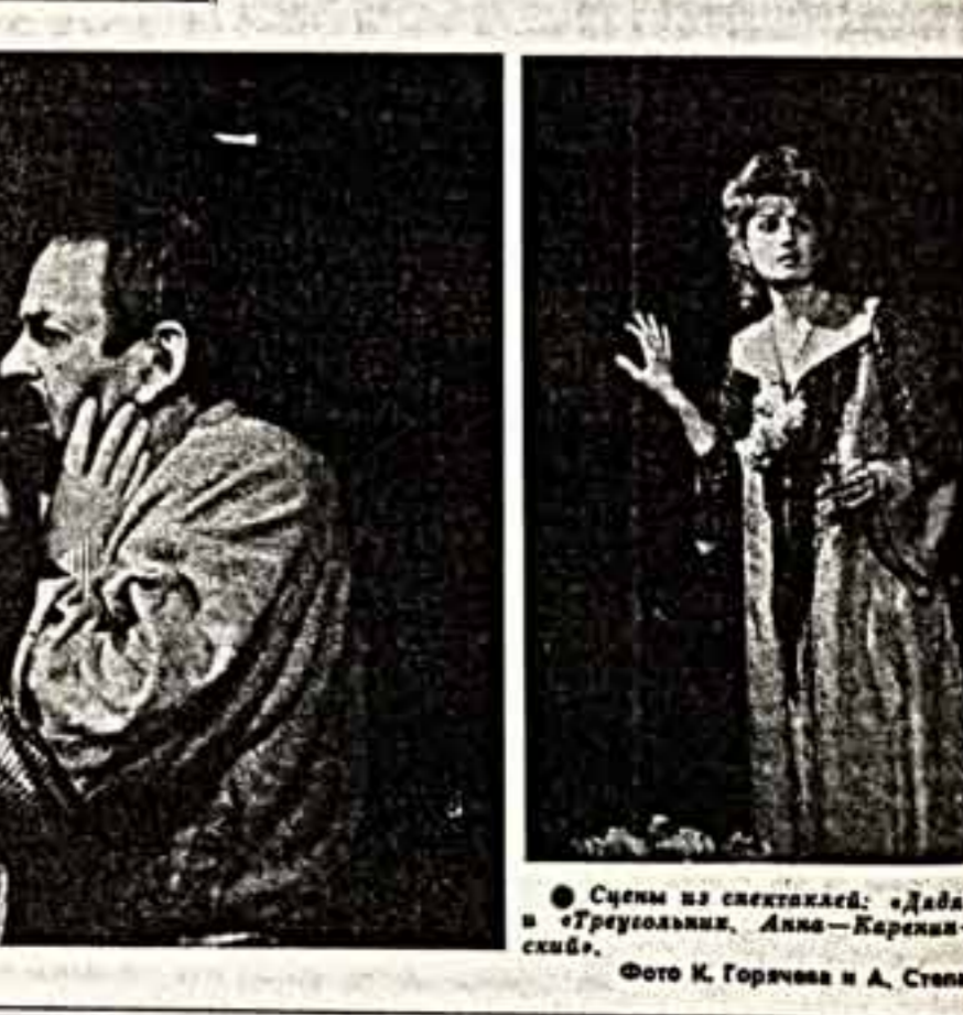
Сцены из спектаклей: «Дада Вальс» и «Грозняк». Анна — Каренин — Вранский.

творца венгерской музыки не разные музыкальной культуры девятнадцатого века.