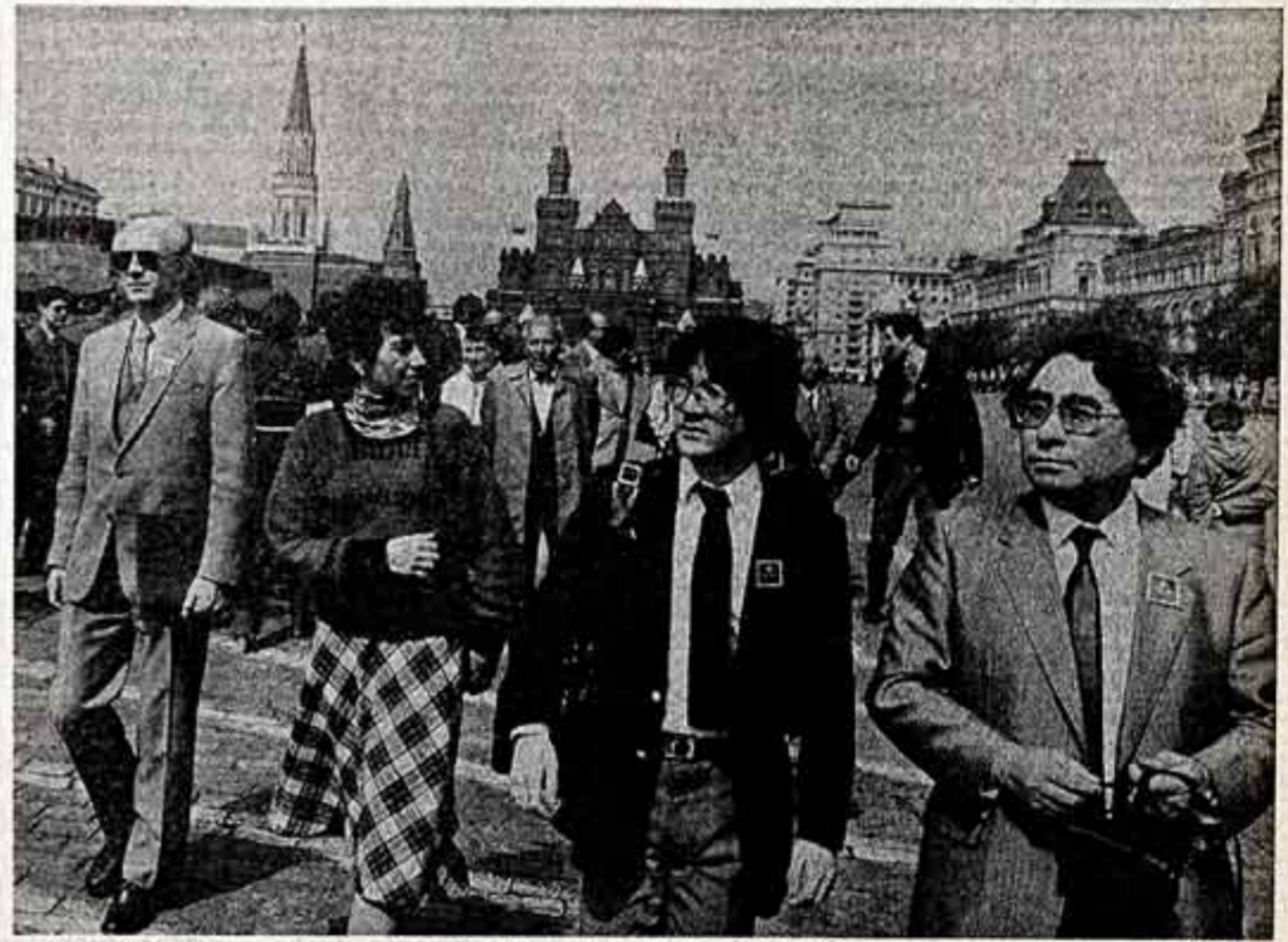
Участники Международного музыкального фестиваля знакомятся с Москвой.

Фестиваль чехословацких фильмов открылся в столице. Киномостр посвящен 29-й годовщине освобождения страны от фашистских захватчиков и проводится в соответствии с планом культурного и научного сотрудничества между СССР и ЧССР. В программу включены художественные ленты последних лет на историческую и современную темы, кинокомедии и научная фантастика. (ТАСС.)