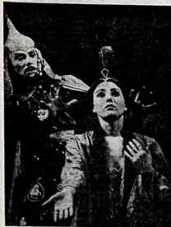
На сцене Дворца культуры железнодорожников Вологды состоялся премьерный спектакль «Валхисарский фонтан»...