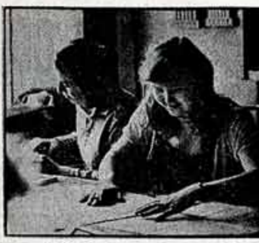
● Приоткрыла резную дверь.