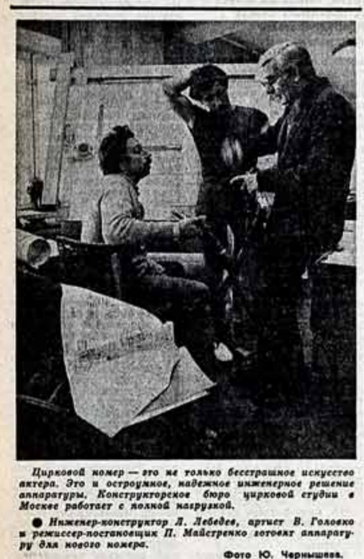
Цирковой номер — это не только бесстрашное искусство актера. Это и остроумное, надежное инженерное решение аппаратуры. Конструкторское бюро цирковой студии в Москве работает с долгой назрелостью.

У К А З Президиума Верховного Совета СССР О награждении тов. Салтыкова А. А. орденом «Знак Почета» За заслуги в развитии советского киноискусства и в связи с пятидесятилетием со дня рождения награждать режиссера кинофильма «Мосфильм» тов. Салтыкова Алексея Александровича орденом «Знак Почета».