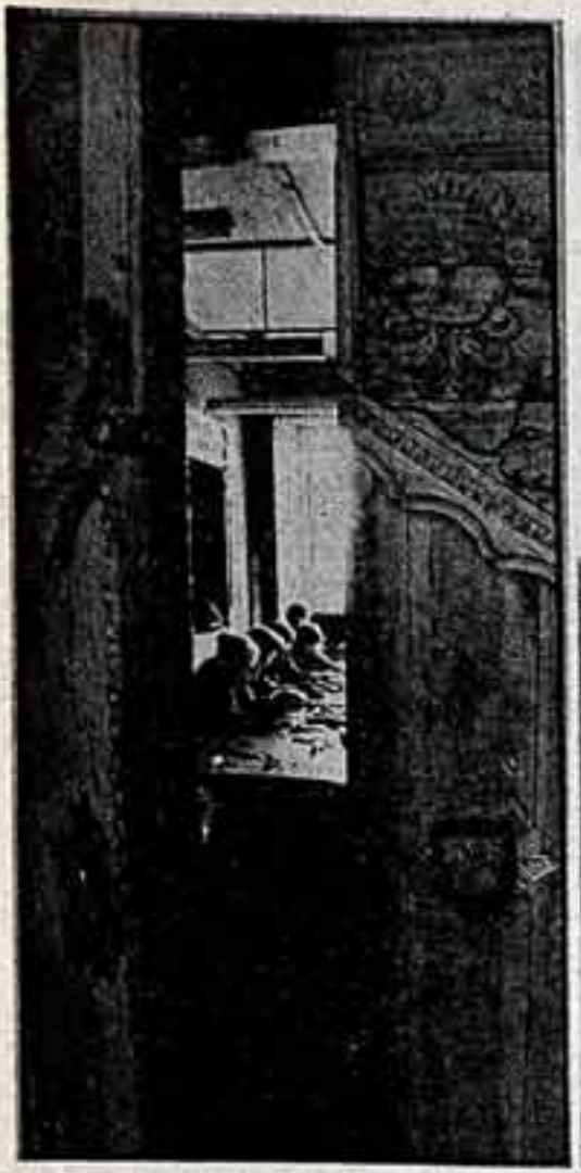
Техническое училище № 23 в городе Великом Устюге готовит специалистов для народных художественных промыслов. На фото — сцен выходит мастера деревянной резьбы: художники рисуют по дереву, резчики по бересте, иконописцы.