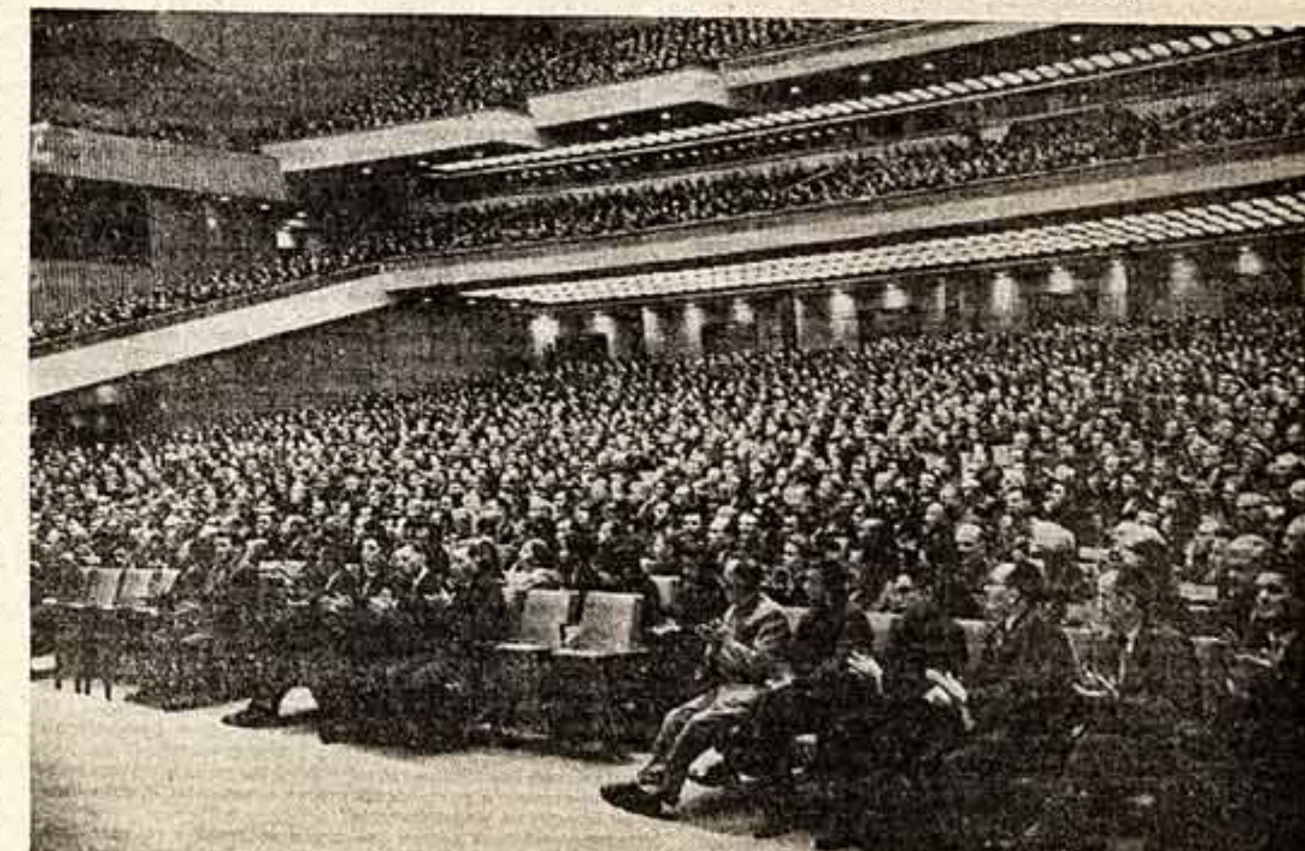
МОСКВА. 17 октября. XXII съезд Коммунистической партии Советского Союза. На снимке: в зале Кремлевского Дворца съездов.