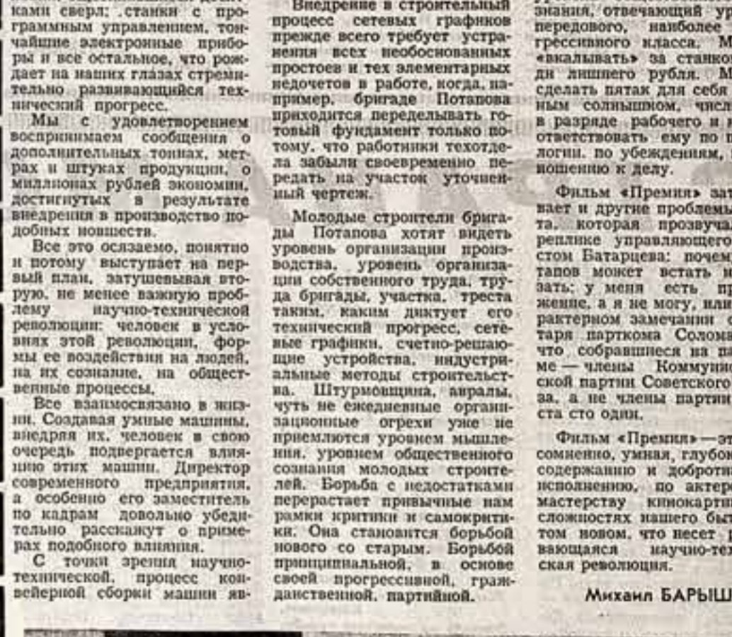
Кадр из кинофильма «Премия».