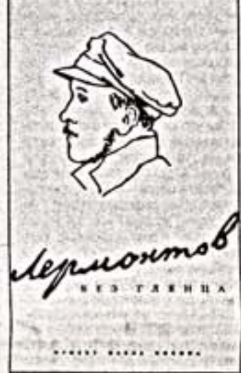
«Лермонтов без глинца». СПб: «Амфора», 2008.