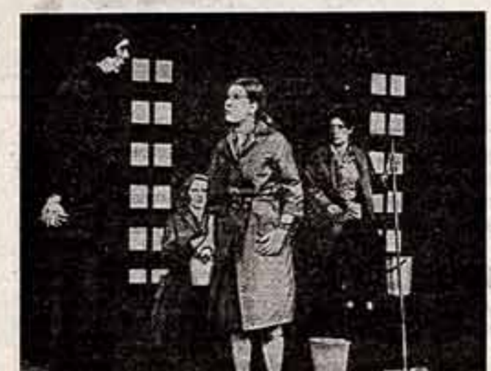
Сцена из спектакля «Женский закон» норвежского национального театра.