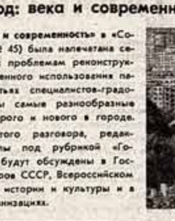
Подводя сегодня итоги этого разговора, редакция надеется, что материалы под рубрикой «Город: века и современность» будут обсуждены в Государстве СССР...