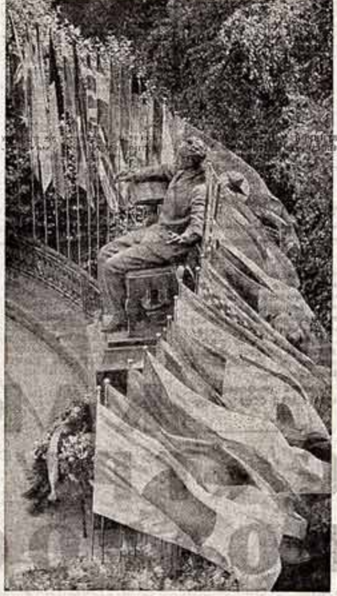
Парад флагов у памятника П. И. Чайковскому.

ПУСТЬ ЕЩЕ БОЛЕЕ КРЕПНЕТ ДРУЖБА МЕЖДУ МОЛОДЫМИ МУЗЫКАНТАМИ МИРА