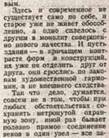
Подводя сегодня итоги этого разговора, редакция надеется, что материалы под рубрикой «Город: века и современность» будут обсуждены в Государстве СССР...