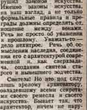
Подводя сегодня итоги этого разговора, редакция надеется, что материалы под рубрикой «Город: века и современность» будут обсуждены в Государстве СССР...