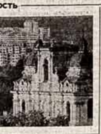
Подводя сегодня итоги этого разговора, редакция надеется, что материалы под рубрикой «Город: века и современность» будут обсуждены в Государстве СССР...