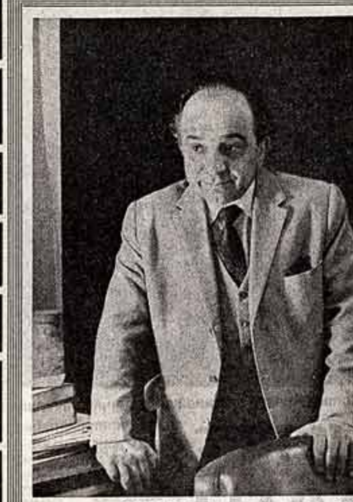
СВИДЕТЕЛЬСТВА ВЫСОКОГО ПРИЗНАНИЯ

Достаточно сказать, что только в течение последних двух лет народные плясуньи из ансамблей «Мирора», «Андрей», «Мирора», «Лина», «Веселия», «Вьюрия», «Прирентина» и другие дали десятки концертов в различных городах и селах нашей страны, а также с большим успехом гастролировали в ГДР, Польше, Иране, Финляндии, Болгарии, Италии, Швейцарии.