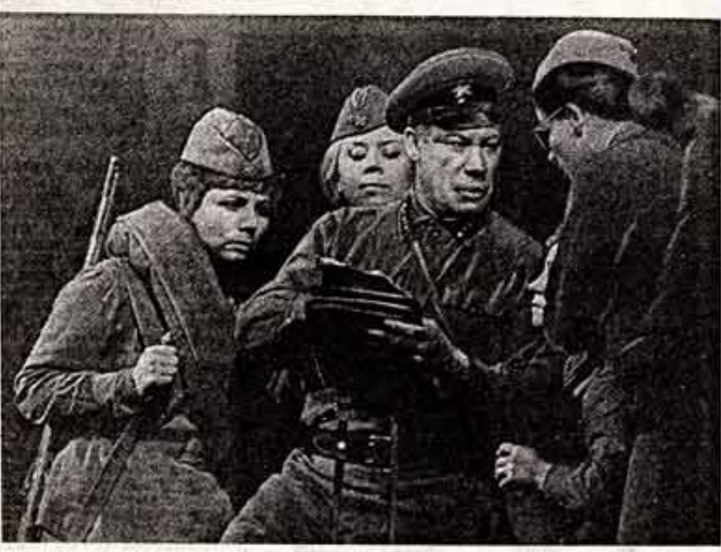
Москвичи и гости столицы увидят девять спектаклей — «Поднятую целину» М. Шолохова, «Макара Дуброва» А. Корнейчука, «Враги бессмертия» К. Крапивы, «А зори здесь тихие...» по повести В. Васильева и другие.

В Москве на сцене филиала МХАТа имени М. Горького успешно проходит гастроли Донецкого областного русского драматического театра города Жданова.