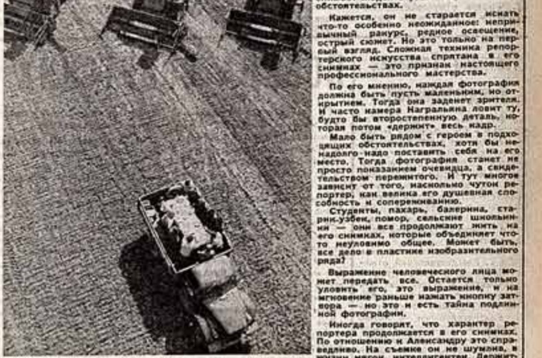
Вера, Надежда, Любовь... Обед в поле. В центре Арктики.