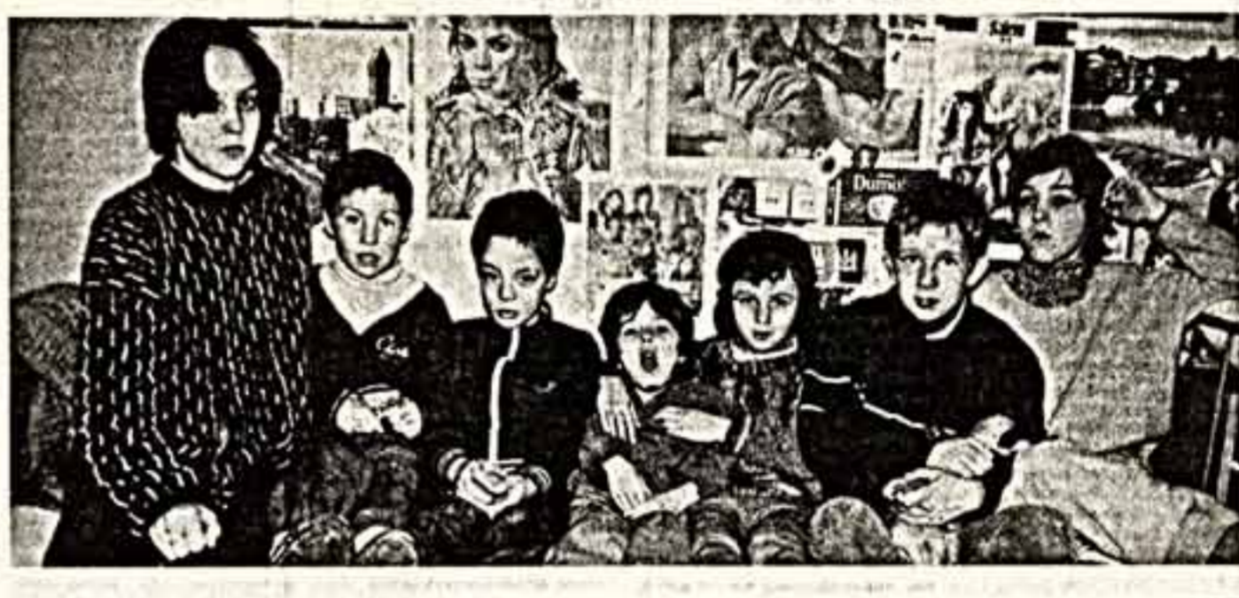
Дети, которых привозит в прюте, поначалу похожи на затравленных диких зверьков.

«Вот так и так, как и всегда, пишу по старому адресу. Москва, «Бережливое»...»