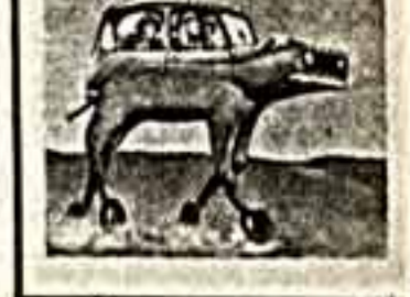
«Вот так и так, как и всегда, пишу по старому адресу. Москва, «Бережливое»...»