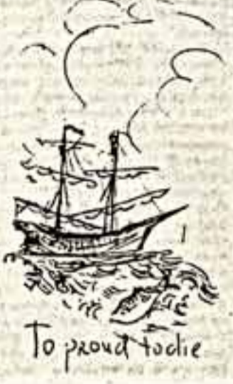
To proud to die