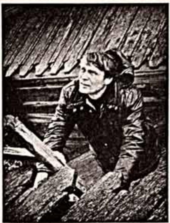
Эти снимки фотограф Евгений Кочетков сделал в перерывах между съемками. На них вы видите известных актеров Владимира Невшова, Олега Меньшикова, Александра Михайлова.

«ИГРА с большой буквы, игра, как некий своеобразный феномен, документальный спектакль... Игра, которой были увлечены ее создатели и участники и которая доставила бы им не только огромную пользу, но и истинное наслаждение...»