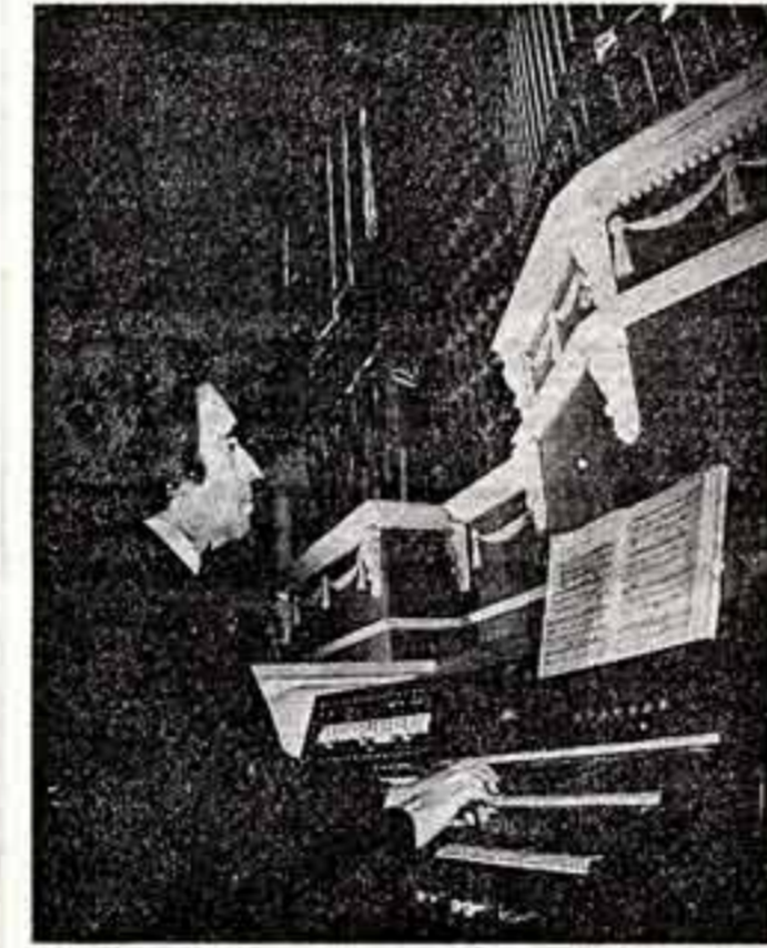
Для встречи с прекрасным искусством, превосходящая собой слушателей и музыкантов, отныне регулярно располагается в бывшем Николаевском соборе, а теперь зал организованной музыки Омской государственной филармонии.

— Мне пришлось первым исполнять музыку на открытии оркестра в Новосибирске, Томске, Кемерове, Красно-