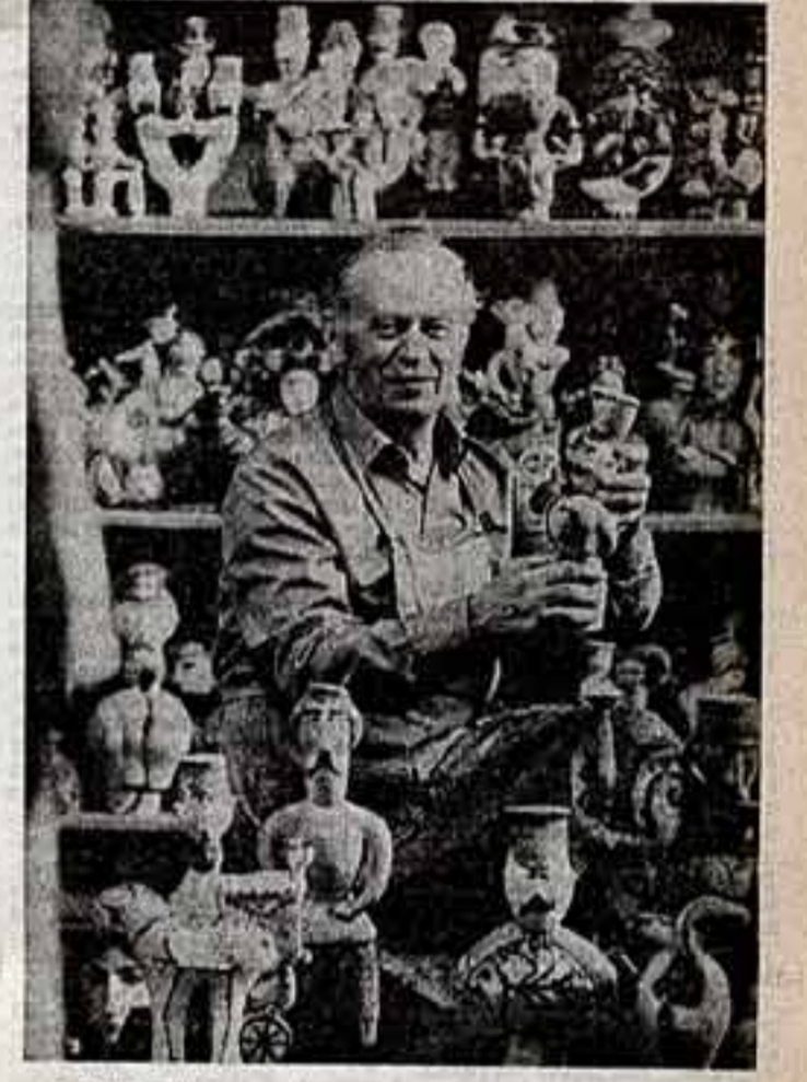
Дивотный мир смешливых, добрых городецких жителей, сказочных птиц и зверей создал московский художник, выходец из Города Е. Растрогуев. Незатейный материал — глина да пошта, да естественные красители в его руках преобразуются в искристые монором образы.