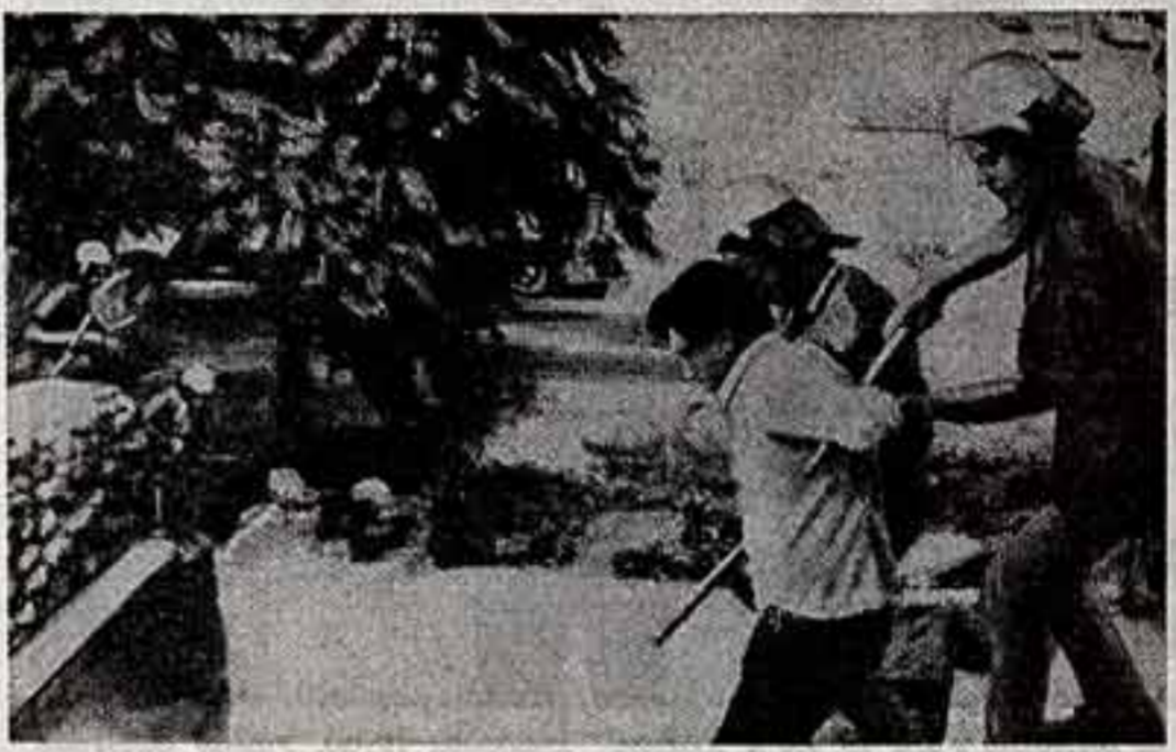
Проведения широкоаспектных карательных акций, террором и репрессиями на Западном берегу реки Иордан израильские захватчики пытаются заставить местное население смириться с режимом оккупации. Особенно израильская солдатия бесчинствует по отношению к палестинским патриотам. На арестовывают дома и прямо на улице, отправляют на годы в тюрьмы, пытки, пытки, пытки. По данным арабской печати, около 4 тысяч палестинцев осуждены военными властями Тель-Авива на длительные сроки заключения.

Помните, как начинаются сказки? «Жил-был (или «жила-была») однажды на свете... Та, о которой сегодня пойдет речь, не героиня сказки, хотя многие называют ее так в искусстве «самой красивой легендой в истории французской песни».