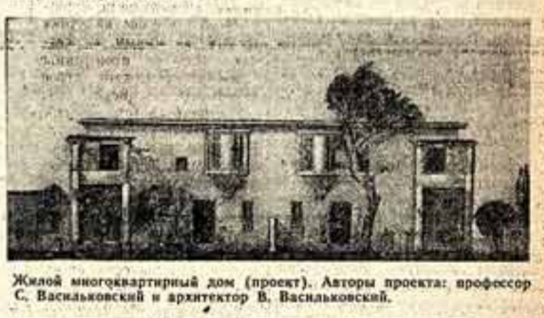
Жилой многоквартирный дом (проект). Авторы проекта: профессор С. Васильковский и архитектор В. Васильковский.