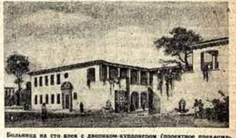
Больница на сто коек с двориком-курдюном (проектное предложение). Автор — кандидат архитектуры Н. Уманский.