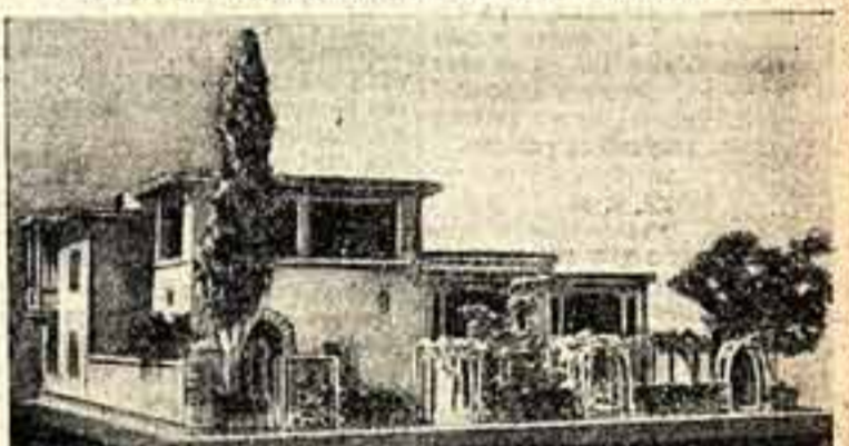
Макет части многоквартирного жилого дома. На переднем плане — дворик-сад (проект). Авторы проекта: профессор С. Васильковский и архитектор Я. Костинка.