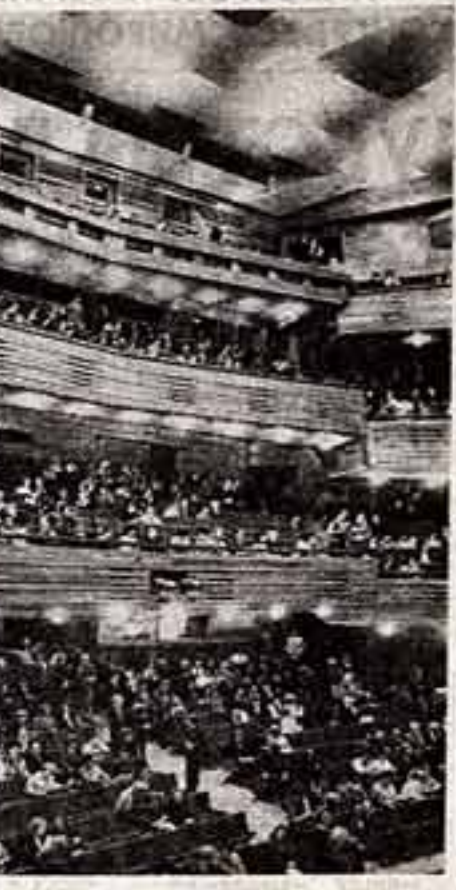
● В зрительном зале.