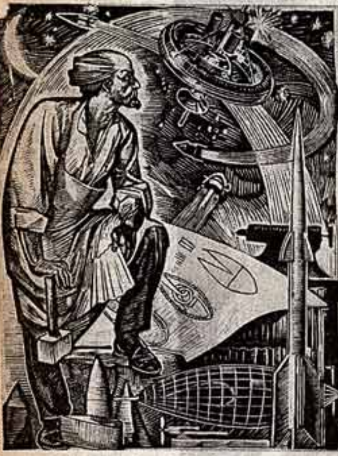
Г. Галкин. «Мечты К. Э. Цюльковского».