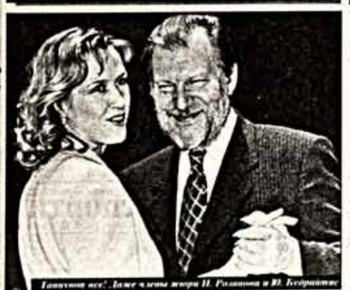
Восьмой Международной фестиваль актеров кино "Созвездие"-97 завершился в субботу. Проводится он с целью поднятия престижа актерской профессии.

Несмотря на то, что в конкурсе участвовали актеры, ведь многие продюсеры не дают картин фестивалю, требуют за них предоставления денег. А денег фестивалю, по словам его президента Евгения Жарикова, как раз и не хватает, финансирование "Созвездия" на самом низком уровне, какой только возможно.