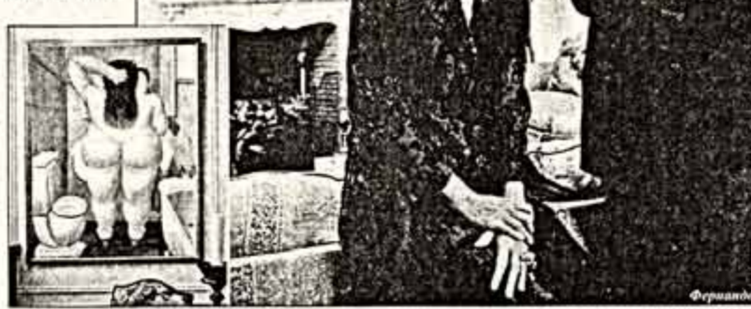
Фернандо Ботеро с женой на фоне своих работ