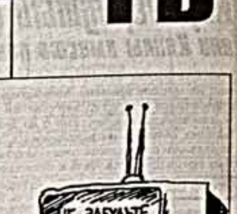
Рисунок В. БОГОРАДА

1 КАНАЛ 8.00 "Доброе утро", 9.00, 12.00, 15.00, 18.00, 19.00, 20.00, 23.00. 9.15, 18.20 "Родина наследство".