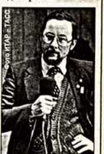
По сообщениям корреспондентов ИТАР-ТАСС и соб. инф.