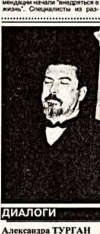
Сцена из спектакля "Наш Антонен Арто"