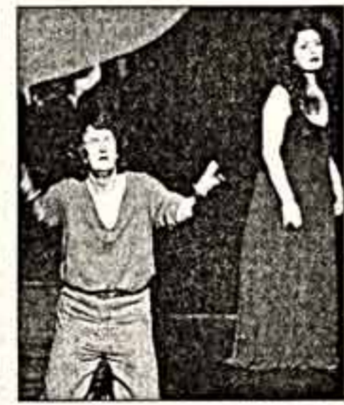
Сцены из спектакля «Парсифаль»