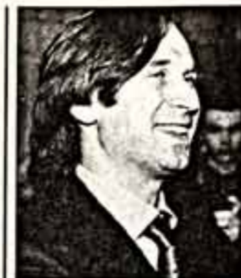
России нужен "третий путь".

Сегодняшнее поколение молодых россиян способно освоить, в котором раз доказав всему миру крепость и мощь нашей Отчизны.