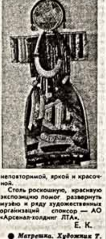
Матрешка. Художник Т. Смирнов.