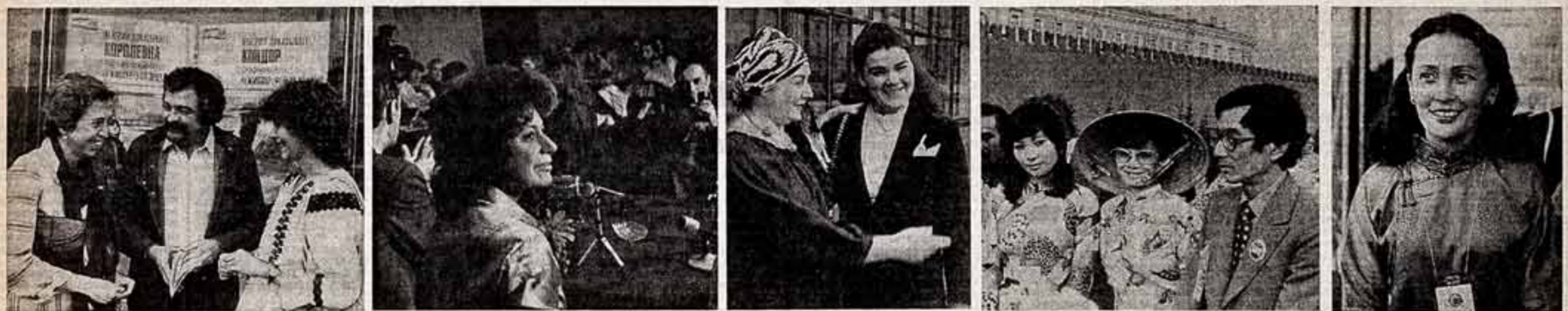
● Советский режиссер Савва Кулиш с венгерскими кинематографистами Сечей Оршош и Эржбет Шадур. ● Режиссер-постановщик из США Джокан Харви на пресс-конференции. ● Австралийский режиссер Самуэля Хоамс с дочерью Амандой.