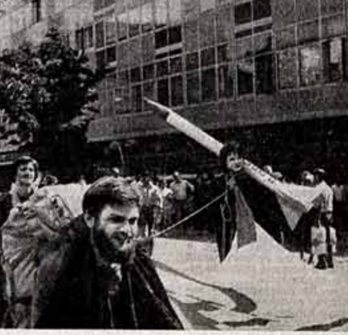
Ал. Авдеенко, спец. корр. «Советской культуры», ШТУТГАРТ.