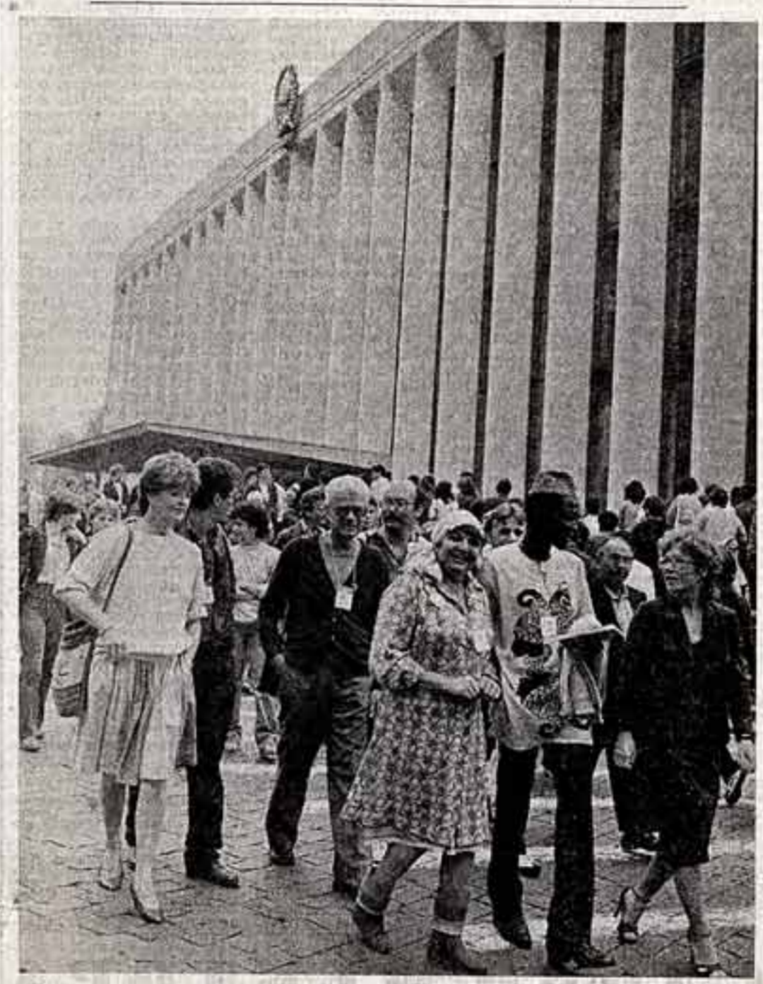
Участники и гости фестиваля знакомятся с Москвой. Незабываемое впечатление на них произвело посещение Кремля.