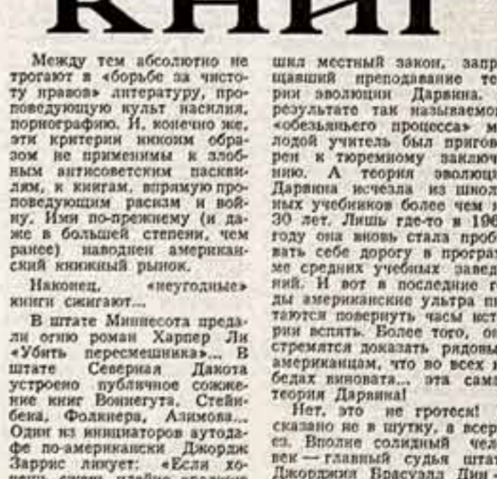
Ал. Авдеенко, спец. корр. «Советской культуры», ШТУТГАРТ.