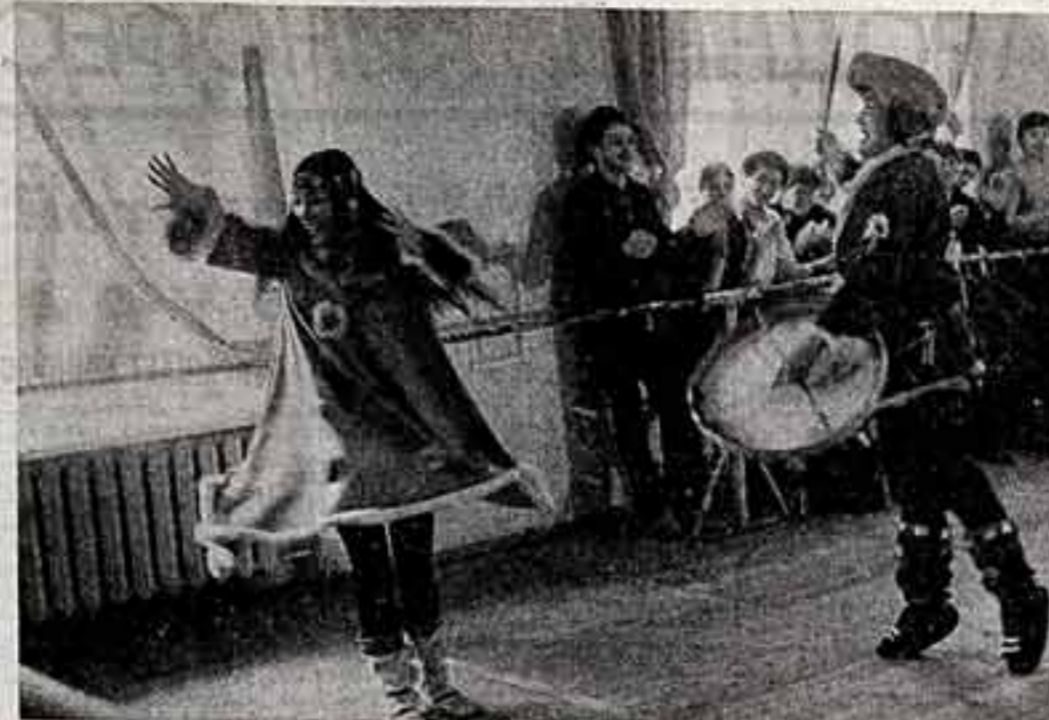
На сцене Государственной премии СССР