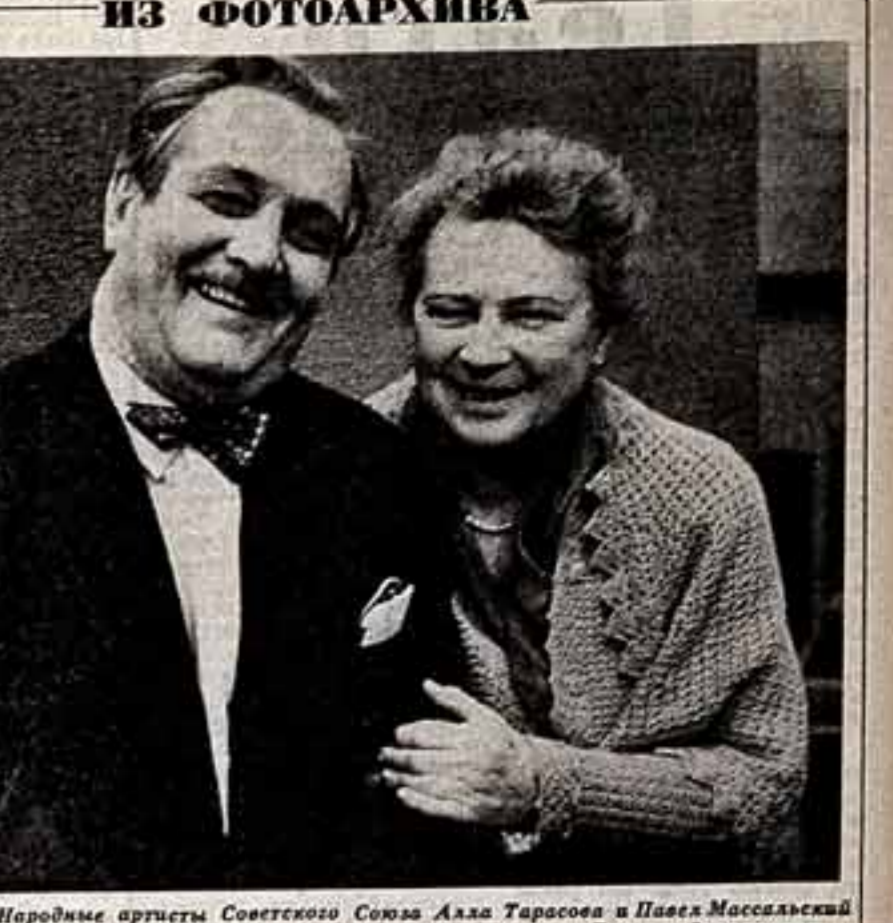
Народные артисты Советского Союза Алла Тарасова и Павел Массальский в период работы над радиоспектаклем «Бел вым вымотыне» в Доме радиоэлектроники и звукозаписи (1973 год).