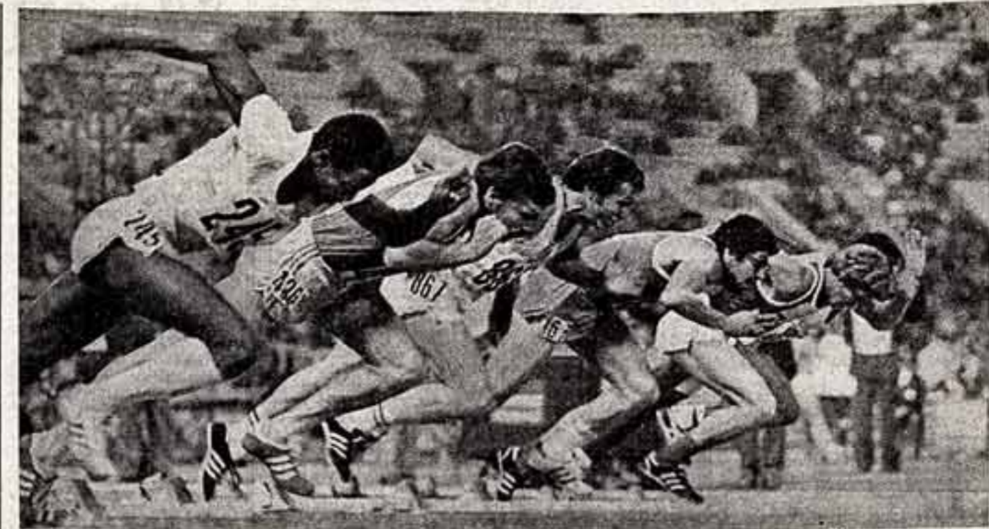
Стартует спринтер.