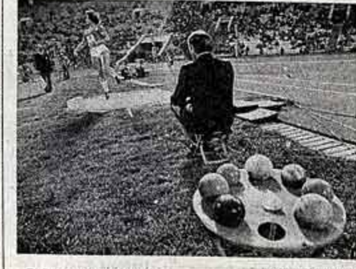
В секторе металла...

К 90-летию звания, заслуженного деятеля культуры Киргизской ССР, издательство «Кыргызстан» выпустило сборник его новых стихов. А. КОМАРОВ, фрэнзе, корр. ТАСС.