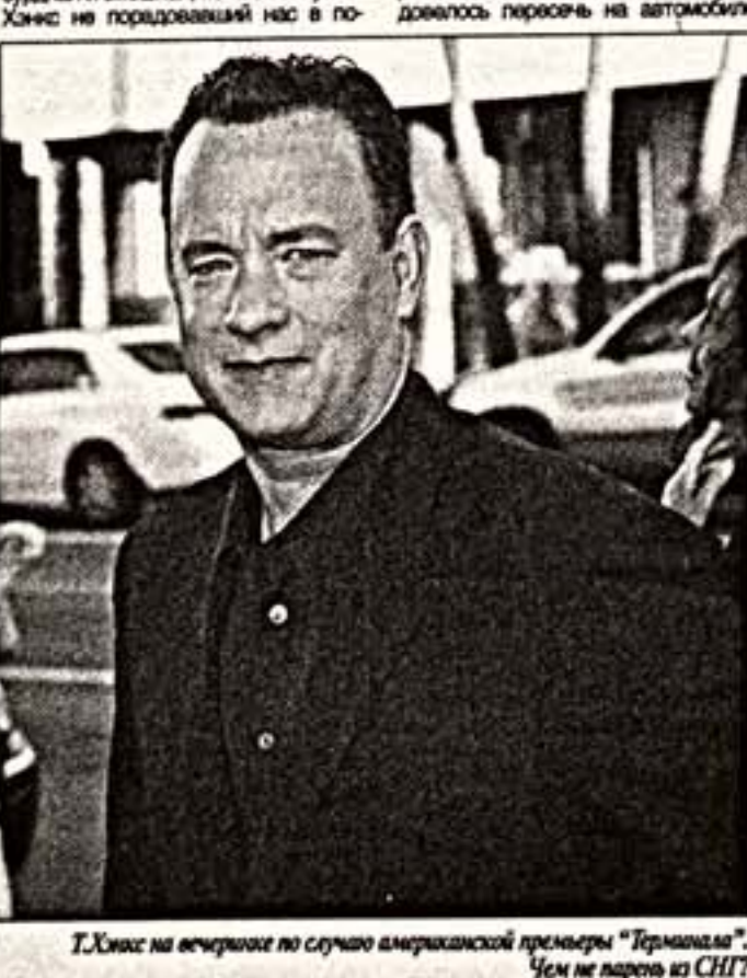
Т.Ханкс на вечеринке по случаю американской премьеры «Терминала». Чем не парочка из СНГ?