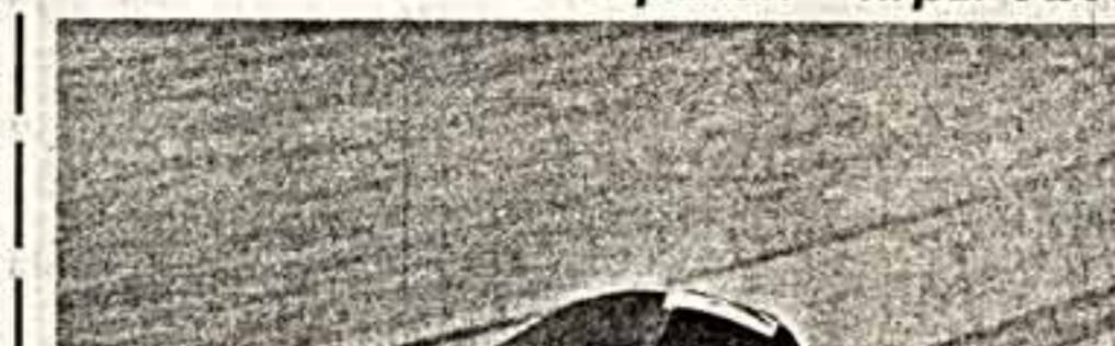
Олимпиадские репортажи будут транслироваться по переднему, второму и четвертому каналам.

Олимпиадские игры охватывают труднейший цикл изумительных гимнастических, художественных, фигурных, ритм, Опи — артиста, если она достигнута — можно дать волю чувствам.