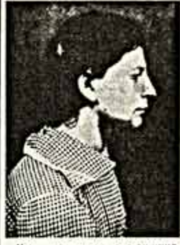
Что мы знаем о женщине, одним выстрелом изменившей весь ход истории? Что звали ее Фанна Каплан...