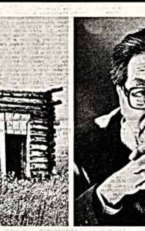
на страницах популярных журналов. За последний год им создана целая галерея портретов деятелей культуры Восточной Сибири. В. ИВАШКОВСКИЙ. (Маш соб. корр.)