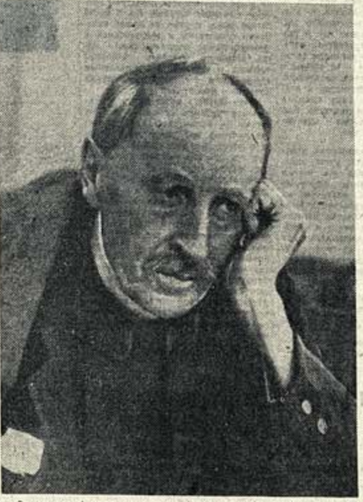
Портрет автора статьи.