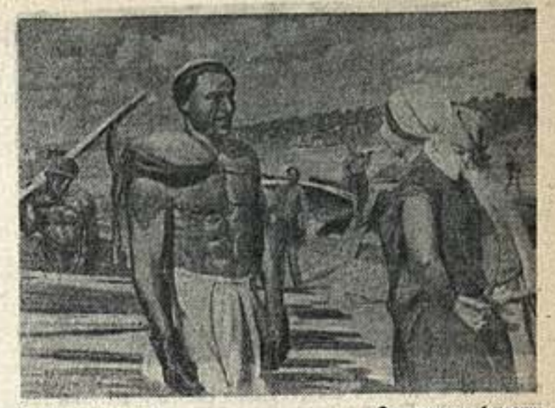
Л. Черно-Плесский «Современные бурляки»