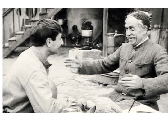
Кадры из к/ф «Необыкновенная выставка»