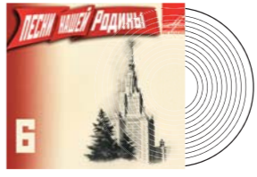
Песни нашей Родины Мелодия

Седьмая (также известная как «Ленинградская») симфония Дмитрия Шостаковича — самое знаменитое произведение выдающегося советского композитора. По мотивам этого шедевра были поставлены балеты, сняты кинофильмы, ему посвящены стихотворения и поэмы, пьесы, живописные полотна. В честь знаменитого исполнения симфонии 9 августа 1942 года в осажденном Ленинграде была установлена мемориальная доска и даже основан музей, посвященный истории создания бессмертного творения. Шостакович сочинил мощнейшее по воздействию произведение всего лишь за пять месяцев: работа продолжалась с июля по декабрь 1941 года. Во многих странах «Седьмая» была воспринята миллионами людей как прямой призыв к борьбе с фашизмом. На этом диске симфония звучит в исполнении Государственного симфонического оркестра Министерства культуры СССР под управлением Геннадия Рождественского.