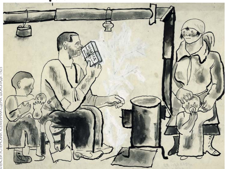
АЛЕКСЕЙ УСПЕНСКИЙ. СЕМЕЙНАЯ СЦЕНА. ШОКОЛАДЬ. 1925

МОСКОВСКАЯ галерея «Ковчег» представляет «глюкозосодержащий выставочный проект» под названием «Сладкая жизнь». Несмотря на ироничное название жанра экспозиции, это настоящая академическая выставка, работы для которой предоставили российские музеи, галереи и частные коллекционеры.