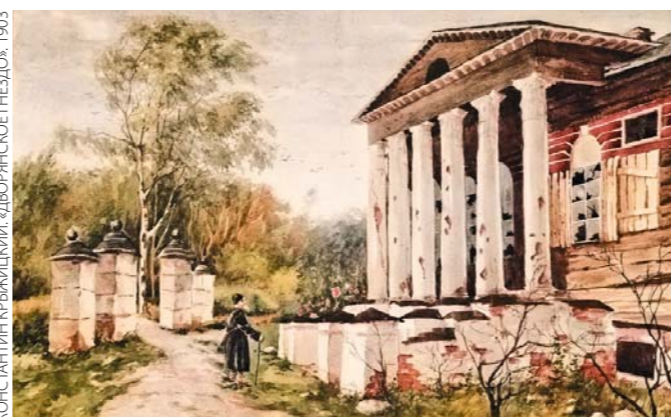
ФОТО: КОНСТАНТИН КИРЯККИН, «ДВОРЯНСКОЕ ГНЕЗДО», 1903