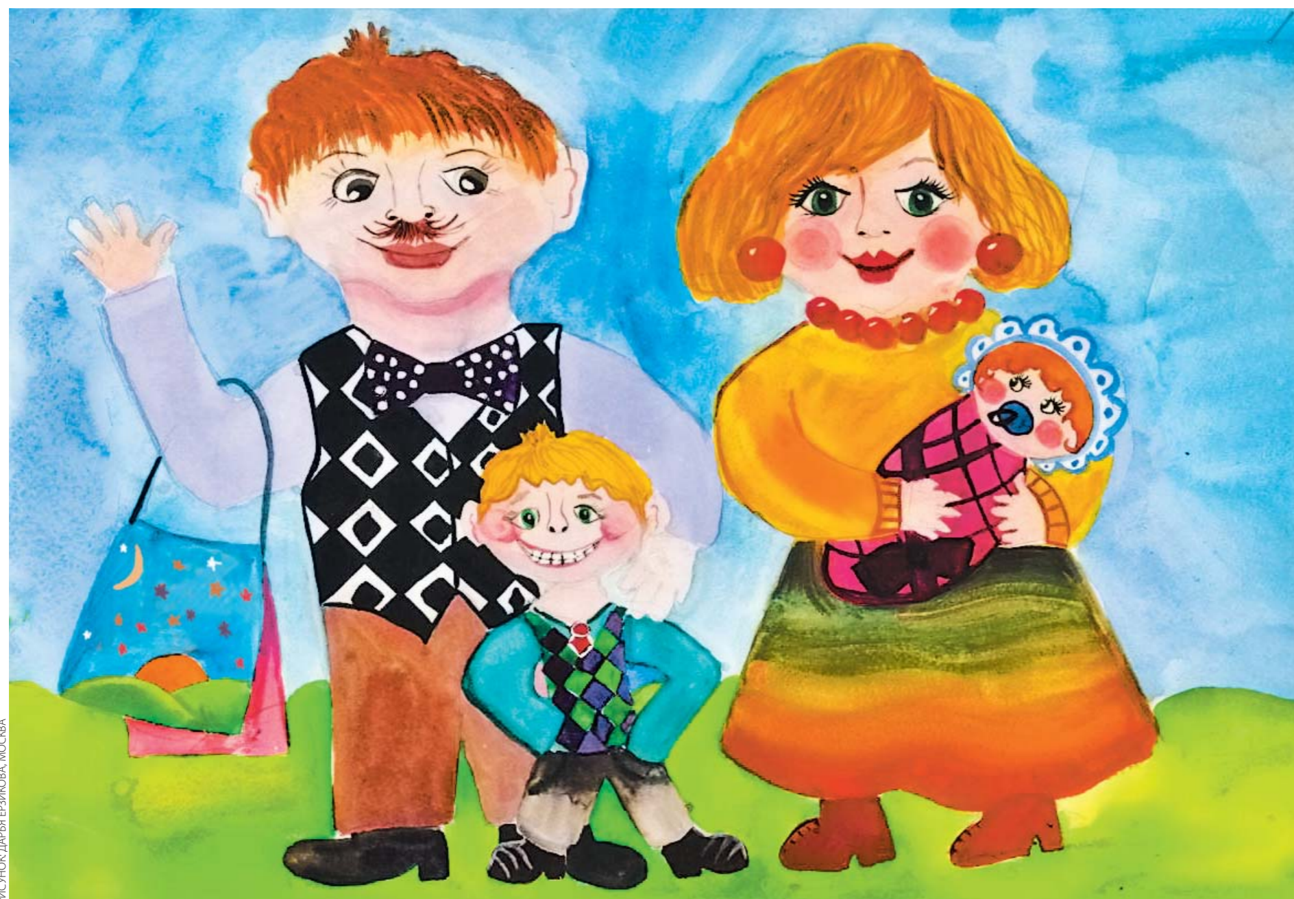
РИСУНОК ДАРЬЯ БЕЗИКОВА, МОСКВА

Начнут ли россияне теплее относиться к брошенным детям?