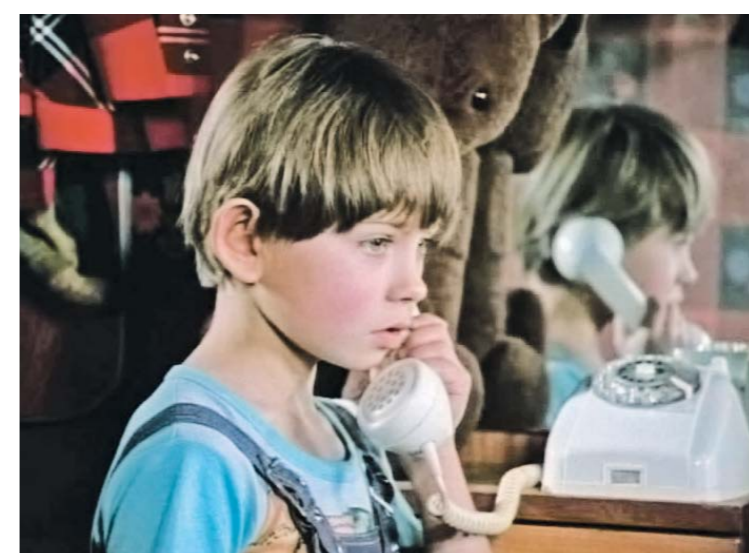
«Удивительные приключения Дениса Кораблева»

Самое страшное воспоминание детства моего друга, как бабушка методично заставляла его читать по двадцать минут в день. Трюк с пролистыванием сразу нескольких страниц не всегда сбавлялся — тайное, как правило, становилось явным.