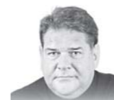
Автор — обозреватель «Культуры»

Словом, как уже часто бывало, принятый закон потребует бесконечных доработок, уточнений, ведомственных инструкций. И в результате выяснится, что законодательная гора вновь родила нежизнеспособную мышь.