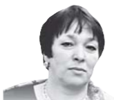
Автор — социальный журналист

Нет сомнений в том, что табачное лобби организует сеанс самой изощренной критики этого документа, подкалывая к таким нападкам известных курильщиков и рестораторов, опасавшихся потерять курящую клиентуру. Но первый решительный шаг на пути расставания с этим наследством Петра Первого уже сделан.