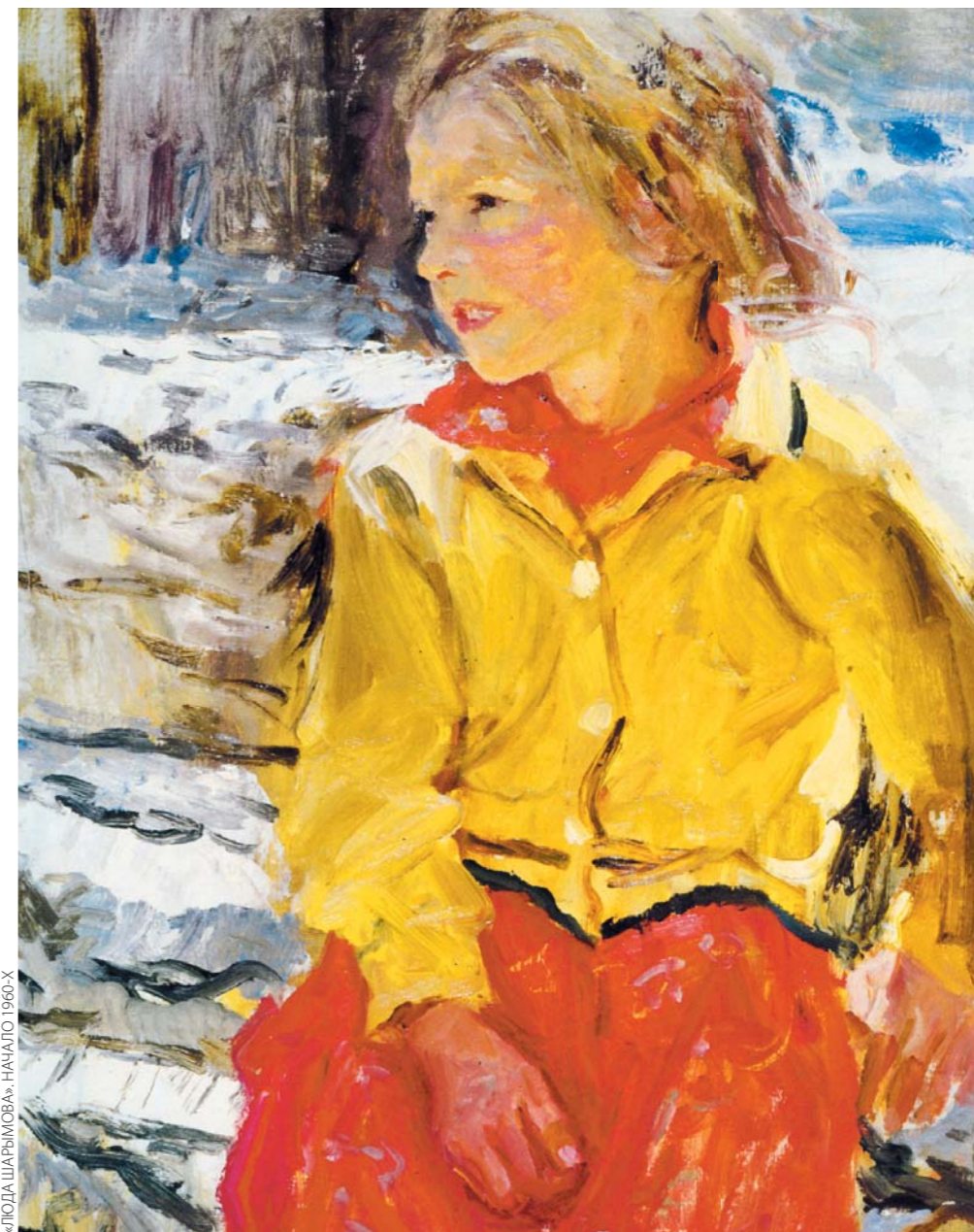
«ЛЮДИ ШАРЫПОВА». НАТАЛИЯ. 1960-х

В ГАЛЕРЕЕ искусств Зураба Церетели открылась выставка «Плещина Вселенной», которой Академия художеств отмечает 120-летие народного художника СССР Аркадия Пластова .