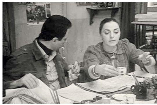
Кадры из к/ф «Голубые горы»