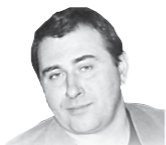
Автор — писатель, публицист

А потому реализацию озвученных правительством и, безусловно, крайне важных планов перевооружения, в первую очередь, нужно начинать с очень жестких мер по наведению порядка в «оборонке». По сути — ее воссозданию. А пока всего этого не сделано, заявленные 20 триллионов мы рискуем просто вбухать в никуда.