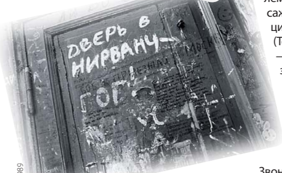
ДМИТРИЙ ЮЗНАДТ. «ДВЕРЬ В КВАРТИРУ БОРИСА ГРЕВЕНЩИКОВА». 1989