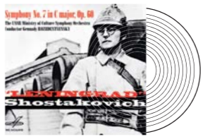
Dmitri Shostakovich Symphony No. 7 in C major, Op. 60 Мелодия

Седьмая (также известная как «Ленинградская») симфония Дмитрия Шостаковича — самое знаменитое произведение выдающегося советского композитора. По мотивам этого шедевра были поставлены балеты, сняты кинофильмы, ему посвящены стихотворения и поэмы, пьесы, живописные полотна. В честь знаменитого исполнения симфонии 9 августа 1942 года в осажденном Ленинграде была установлена мемориальная доска и даже основан музей, посвященный истории создания бессмертного творения. Шостакович сочинил мощнейшее по воздействию произведение всего лишь за пять месяцев: работа продолжалась с июля по декабрь 1941 года. Во многих странах «Седьмая» была воспринята миллионами людей как прямой призыв к борьбе с фашизмом. На этом диске симфония звучит в исполнении Государственного симфонического оркестра Министерства культуры СССР под управлением Геннадия Рождественского.