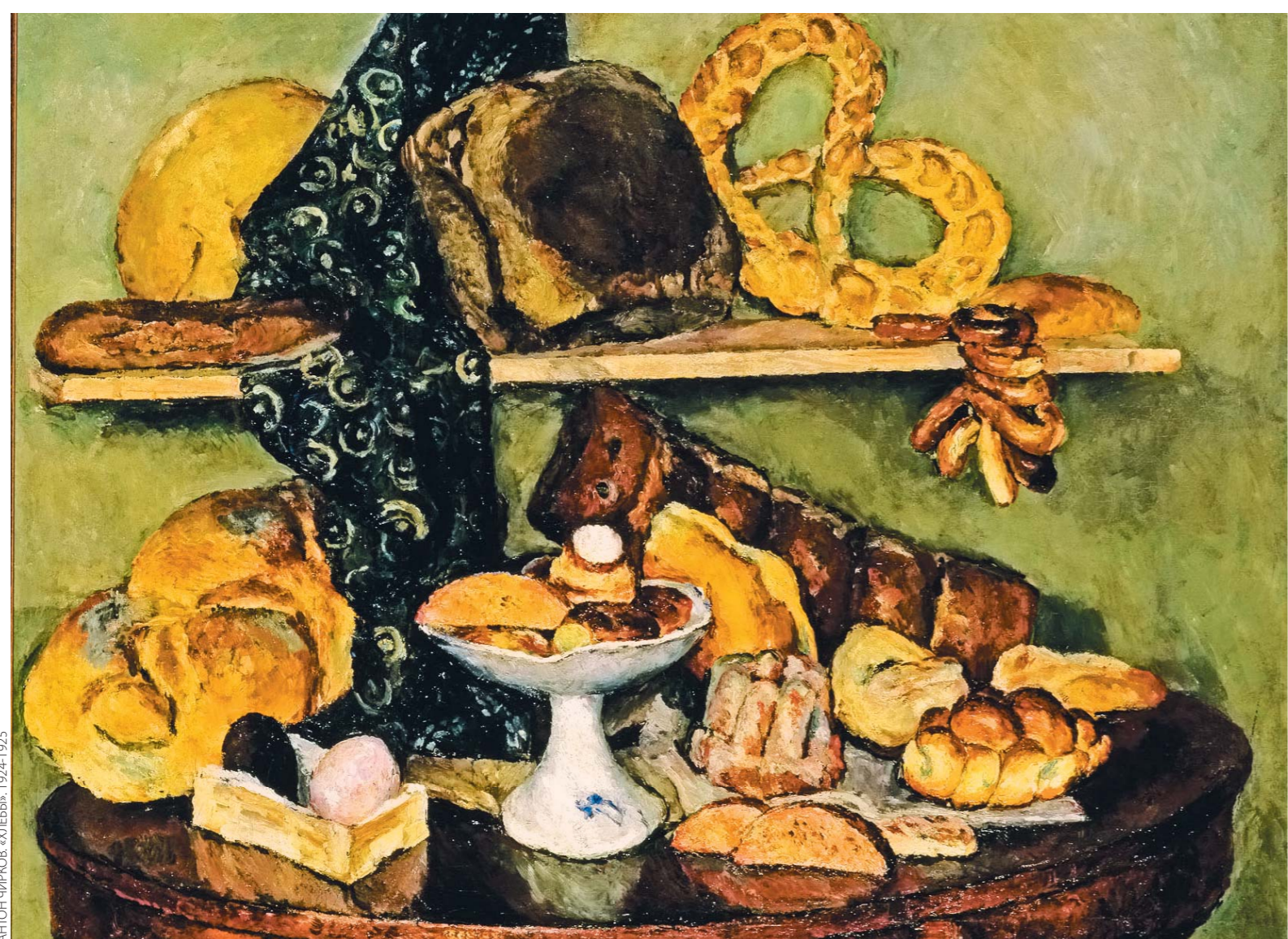
АНТОН ЧИРКОВ. «СЛАДКАЯ ЖИЗНЬ». 1935

«Сладкая жизнь» — это конфеты, сахар, чай, кофе и фрукты, домашние пирожки и пикники. А еще dolce vita в феллиниевском смысле — театры, рестораны, балы. Сюда даже затесались фавны и нимфы с «Аллегории» Антона Чиркова 1935 года. Подбор авторов широк и великолепен — от Бориса Кустодиева и Петра Кончаловского до безымянных создателей одноразовых упаковок сахара, что торжественно разложены на одной из витрин.