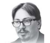
Автор — обозреватель «Культуры»

досодержания — главной цели любой нормальной власти. Подрастающее поколение надо оберегать от любого негатива, даже уголовно не наказуемого. Будь то алкоголь или табак, фильмы или печатная продукция определенного содержания, ну и, наконец, те самые «гей-парады», направленные в том числе и на то, чтобы сформировать у несовершеннолетних «искаженные представления о социальной равноценности традиционных и нетрадиционных брачных отношений». Последнее — цитата из упомянутого законопроекта, сухая фраза, за которой стоит вполне определенное содержание. Взгляните на старшину Европу — воспроизводство населения там происходит в значительной степени при помощи гостей с Востока, которые, кстати, пока только