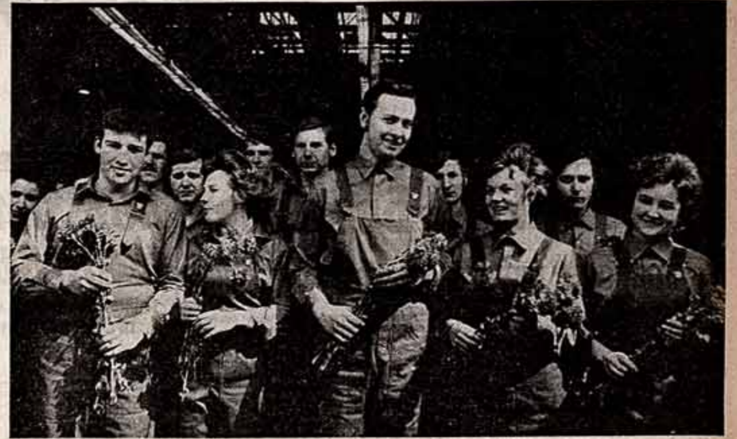
В. СОБОЛЕВ. «Рабочая вахта».

Естественно поэтому, что «заслуженный» подвиг советского человека с первых шагов став предметом пристального внимания не только ученых и специалистов, но и представителей художественного творчества. Тема человека и космоса властно вошла в литературу, шагнула на экран, зазвучала на полтонах