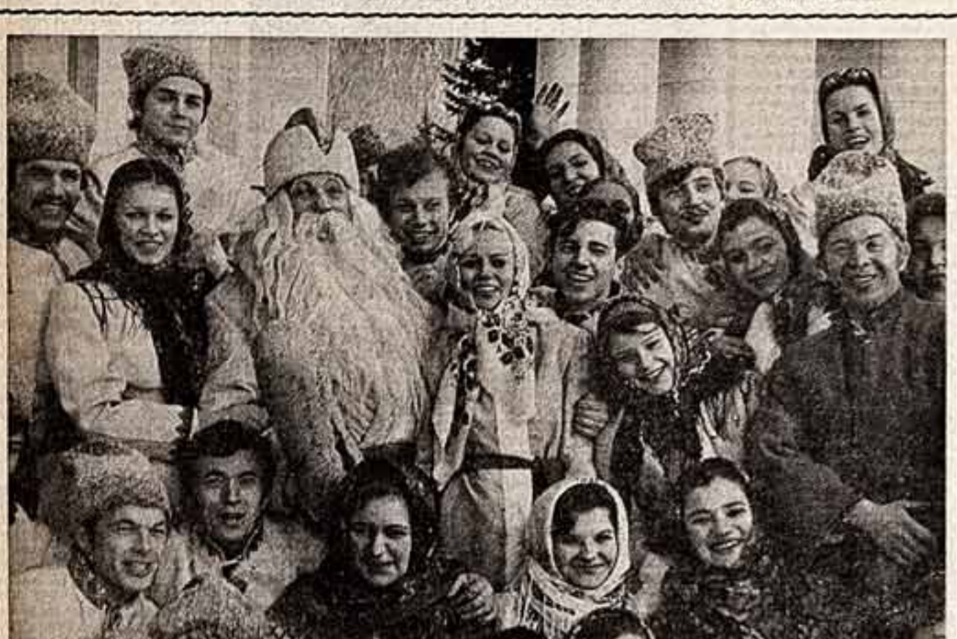
Участники народного фольклорно-этнографического ансамбля «Веснянка» Киевского государственного университета...

Мы не будем сейчас забираться в теоретические глубины, хотя вопрос сам по себе исключительно глубокий.