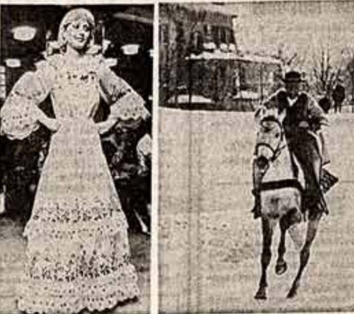
На празднике большую коллекцию оригинальных вечерних туалетов. «На льжах за ездником». Победителем соревнований, которые проводятся в Якопане (Польша), будет вручен приз Девы Мороза.