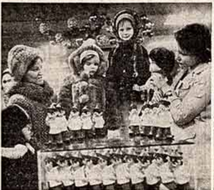
В Центральном универсаме Бухареста в эти дни особенно оживленная торговля. Маленькие покупатели с интересом рассматривают «будущие подарки».

Кардинальной проблемой успешного развития социалистического искусства и культуры в Болгарии является непрерывное углубление их связей с жизнью народа, уделяется особое внимание дальнейшему совершенствованию системы управления культурой. В ходе осуществления генеральной линии партии во всех областях общественной жизни (в том числе и в сфере культурной деятельности) была создана новая система управления, которая превратилась в могучий инструмент общественного прогресса. Правильность и целесообразность введения общенациональной системы управления культурой жизнью страны, явившегося продолжением