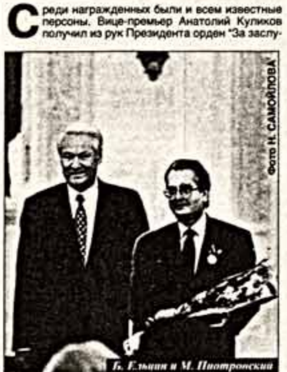
Б. Ельцин и М. Пятровский

ги перед Отечеством" III степени и ордена награду "как кредит доверия верховного главнокомандующего". Такой же орден вручил Б.Ельцин секретарю Совета безопасности Ивану Рыбкину.