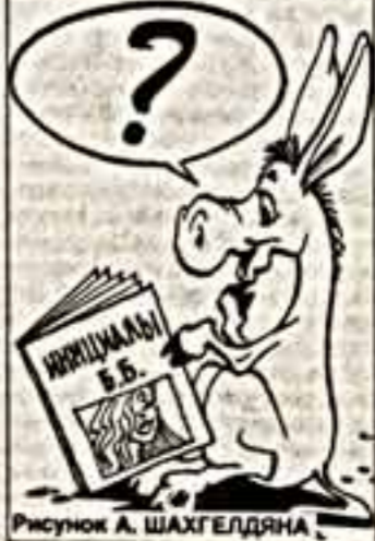
Рисунки А. ШАХГЕДЯНА

Нина ХОТИНСКАЯ, переводчица, член Союза писателей