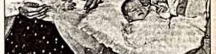
Изабелла Росселлини с сыном