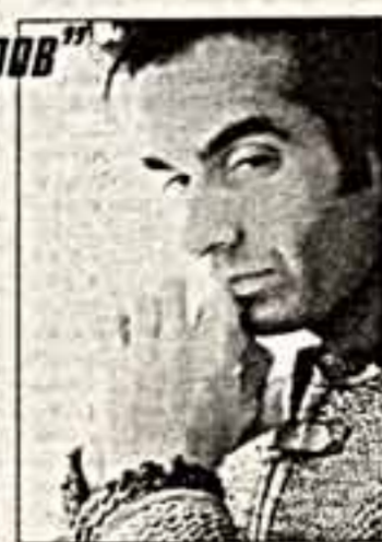
Выступает. Кроме того, представители СМИ узнали, что Д.Колперфилд привозит в Россию свою реабилитационную программу "Проект Магия"...