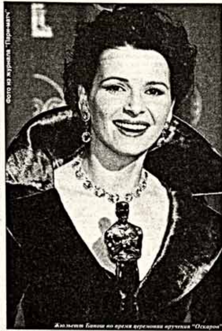
Жюльетт Бинош во время церемонии вручения "Оскара"