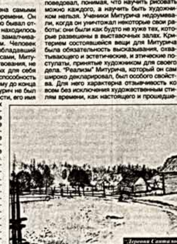
"Горыня Салма тина", 1922 г.

Юрий Митурич отмечен самыми трагическими знаками времени. Он не был репрессирован, но бывал отлучен от работы. Его имя не находилось под запретом, но старательно замалчивалось и обходилось вниманием.