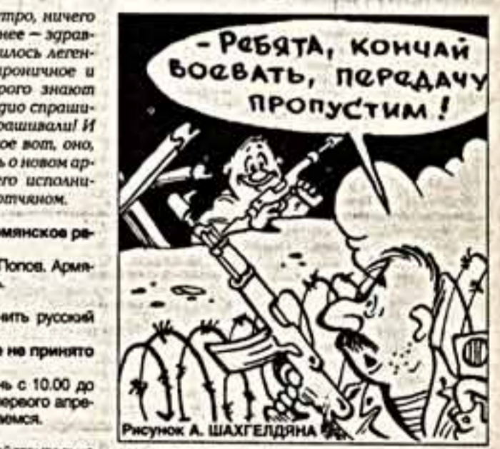
Рисунки А. ШАХГЕЛДЯНА

— Если нам удастся помирить хотя бы двух людей разных национальностей, я считаю, что прожил жизнь не зря. Нам хотелось дать людям разных профессий, возрастов, национальностей возможность лучше узнать друг друга, понять, что, несмотря на различия, проблемы у всех очень похожи.