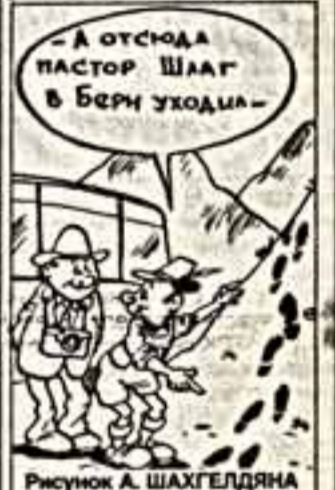
Рисунок А. ШАХГЕЛДЯНА