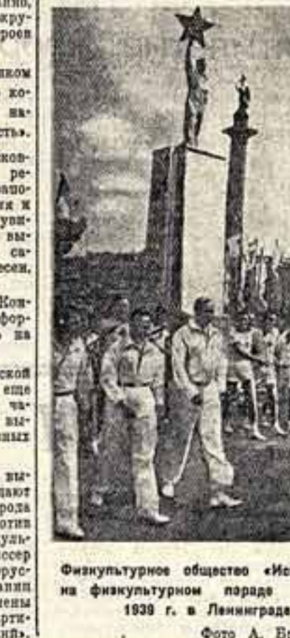
Физкультурное общество «Искусство» на физкультурном параде 8 июля 1939 г. в Ленинграде.

На выставке представлена богатая коллекция архивных альбомов и прекрасных гравюр о событиях и людях Французской революции. Большинство этих вещей никогда не воспроизводилось в печати.