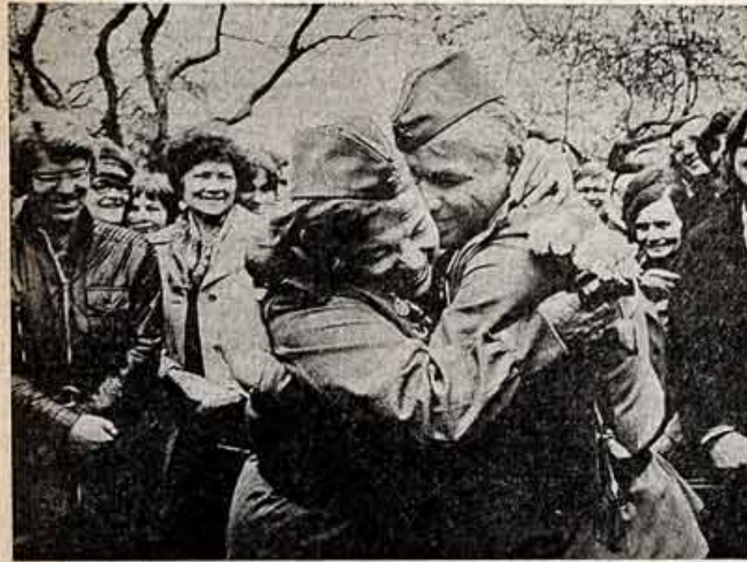
В. СПИЦЫН. «Встреча».