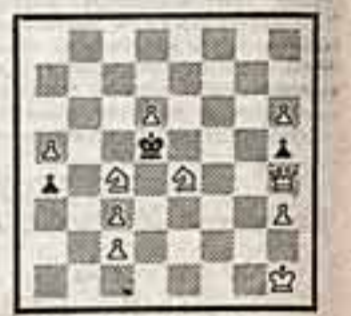
Мат в 3 хода

Авторы этих композиций до войны считались способными шахматистами. Они погибли на фронте, не дождавшись решения своего дракона.