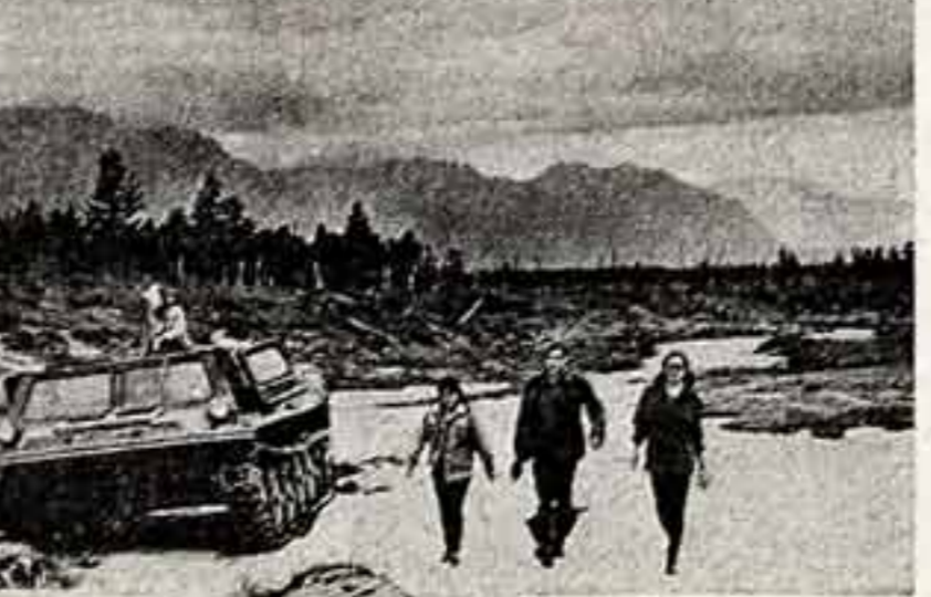
В. ЛОГАЧЕВ. «Гимн миру».