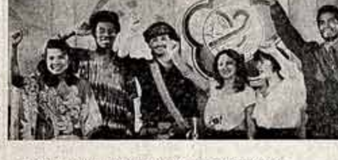
Участники программ «Салют, фестиваль!»