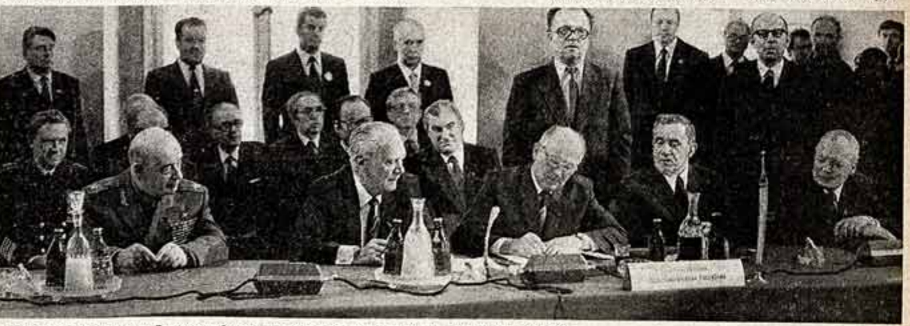
Глава советской делегации Генеральный секретарь ЦК КПСС М. С. Горбачев подписывает протокол.