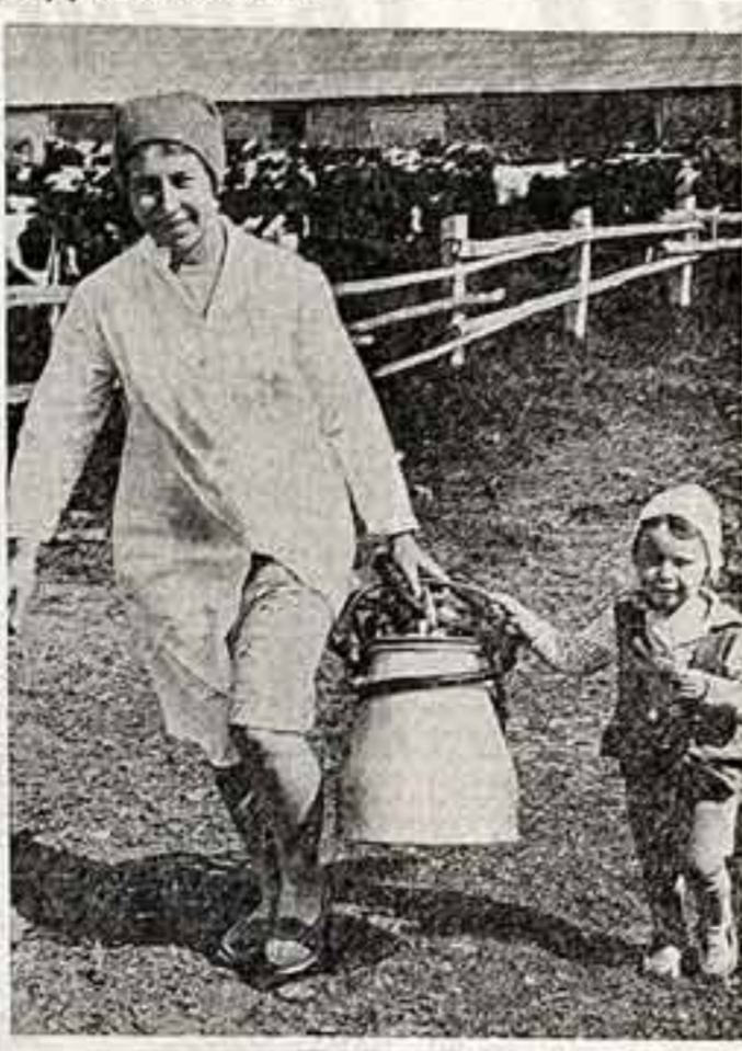
● Б. ДОЛМАТОВСКИЙ. «Маршал Ботраман за игрой в шахматы». ● В. ВУРЛАЕВ. «Ресата». ● Н. ЗИНЧУК. «Помощница».