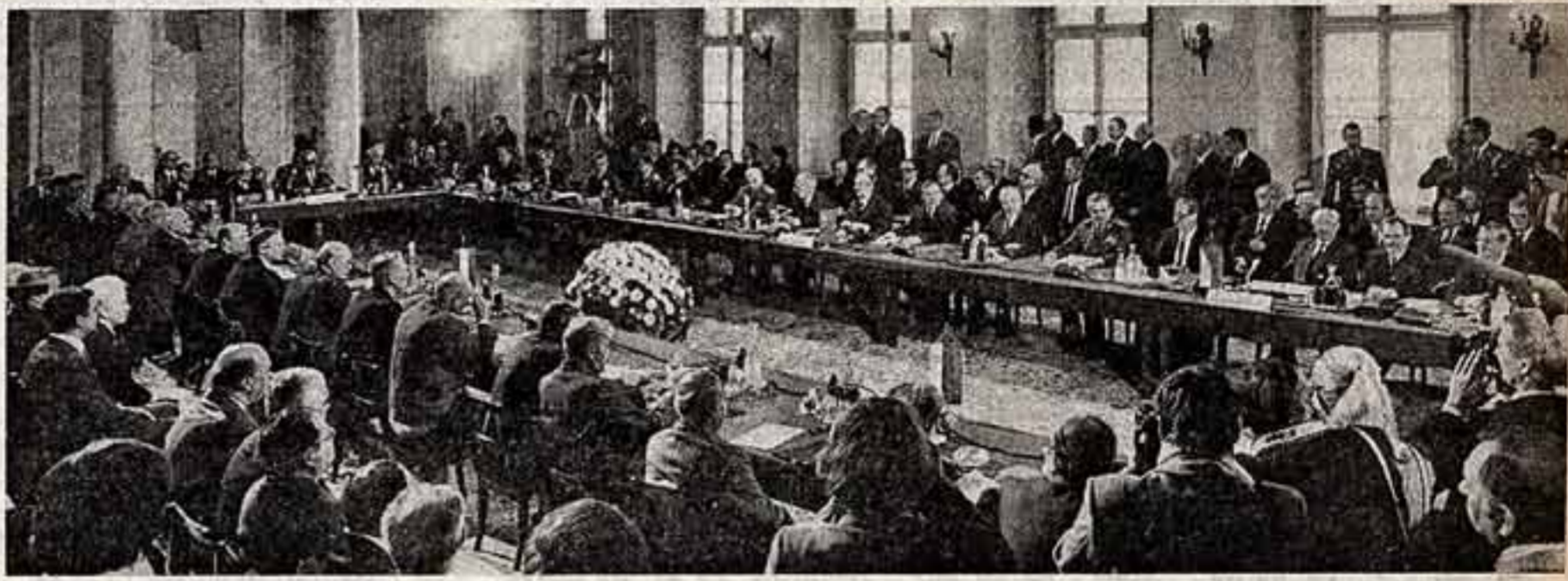
Во время встречи.

Итоги работы апрельского Пленума ЦК КПСС встречены у нас в стране с огромным интересом и горячим, единодушным одобрением. Они вызвали широчайший резонанс и за рубежом. Документы Пленума активно, по-деловому обсуждаются в партийных организациях, трудовых коллективах. С высокими партийными критериями сверяют сегодня свой труд, свои поступки, свершения и планы коммунисты, все трудящиеся. Они заявляют о своей решимости достойно встретить XXVII съезд родной партии, крепить неустанным трудом, образцовой работой экономическое и оборонное могущество социалистической Отчизны.