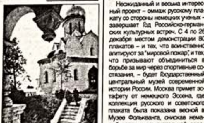
Саввино-Сторожевский монастырь в Зеленогорске