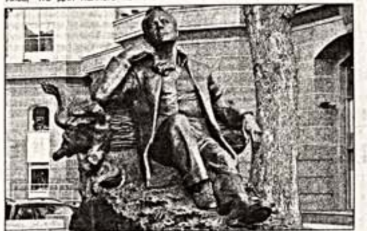
Памятник Ф.И. Шалапину на Новинском бульваре

В настоящее время в Москве мно-... гие средства массовой информации,