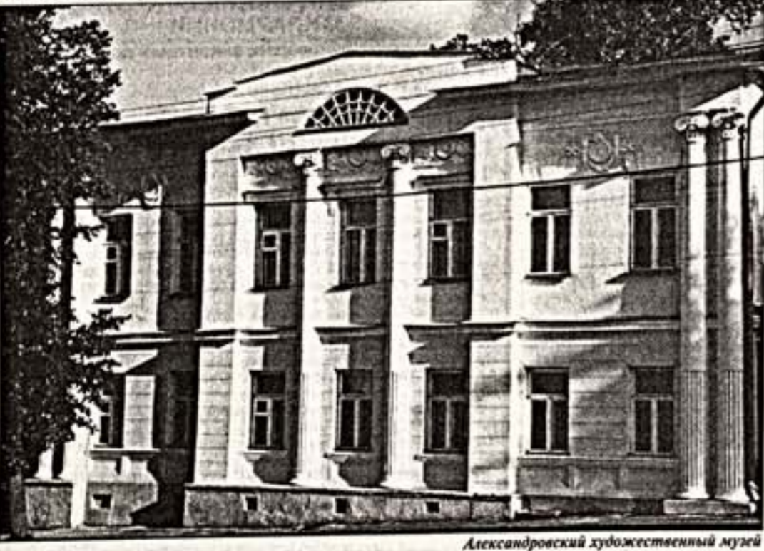
Александровский художественный музей

В 2004 году наше министерство... провело "ревизию" имеющихся