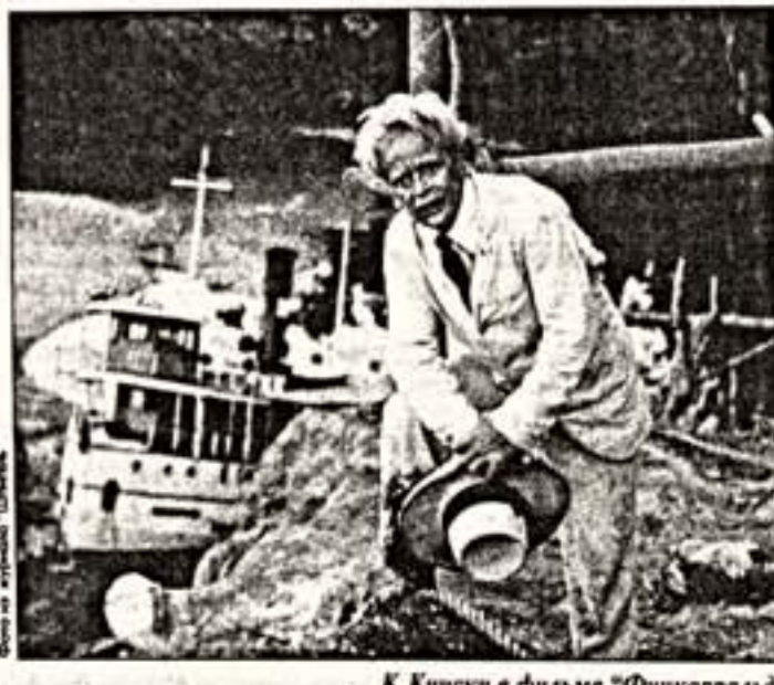
К. Кински в фильме "Фицджеральд"