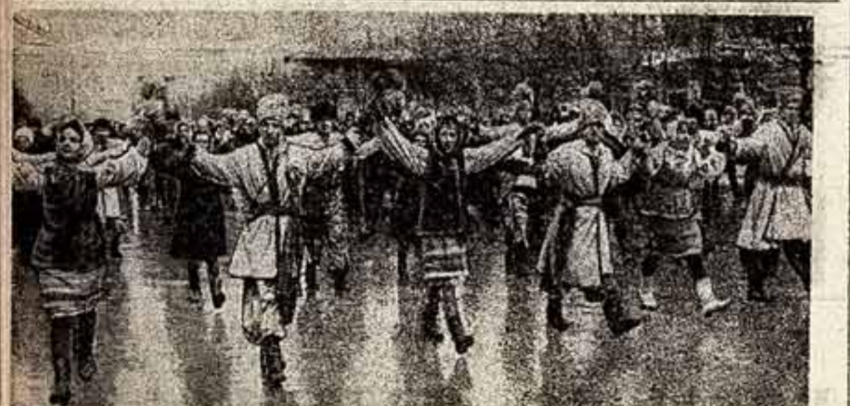
Демонстрация трудящихся в Киеве в ознаменование 50-летия Советской Украины.