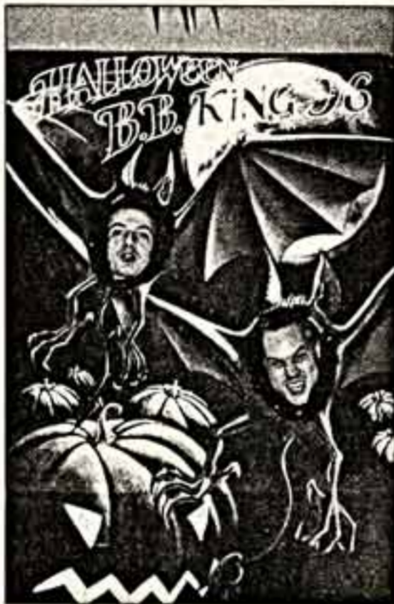
Хэллоуин в Москве.