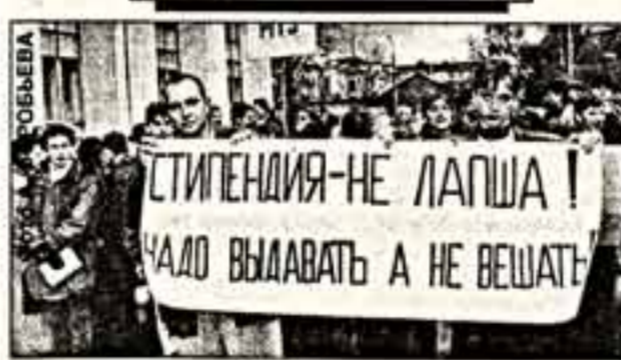
ДЕНЬГИ НА БОЧКУ

Руцкой запретил народу требовать у правительства деньги