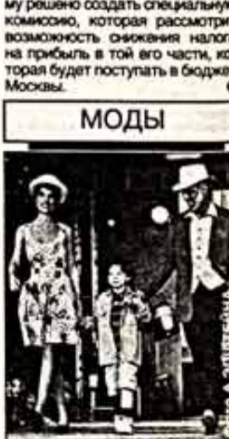
Римлянка и аргентинец