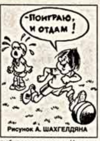
Рисунок А. ШАХГЕЛДЯНА