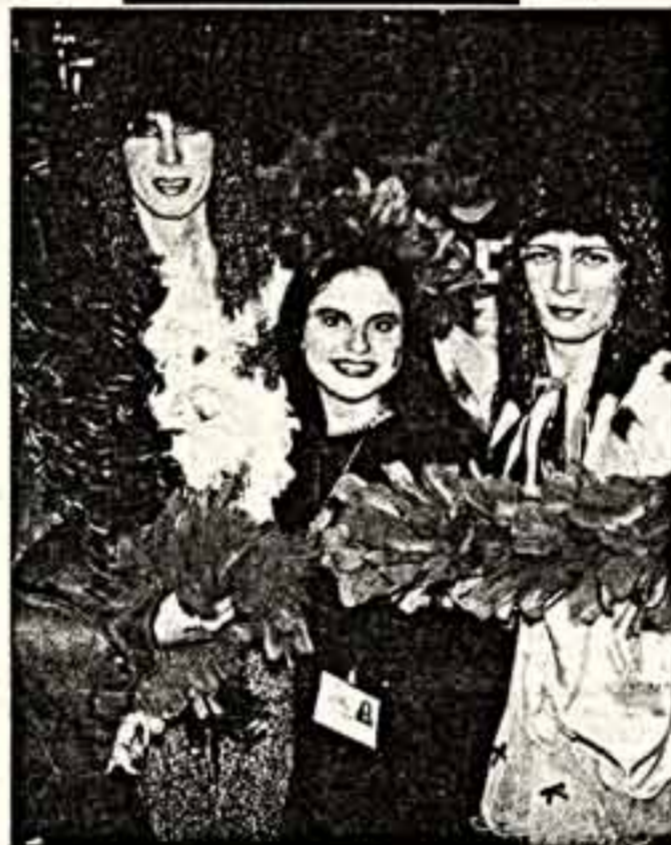
Хэллоуин в Москве.