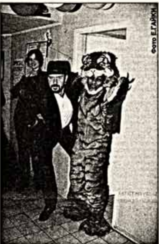
Хэллоуин в Москве.