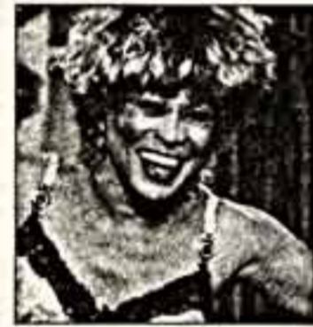
Московского Кремля, которая не позволила зрителям свободно выразить эмоции...