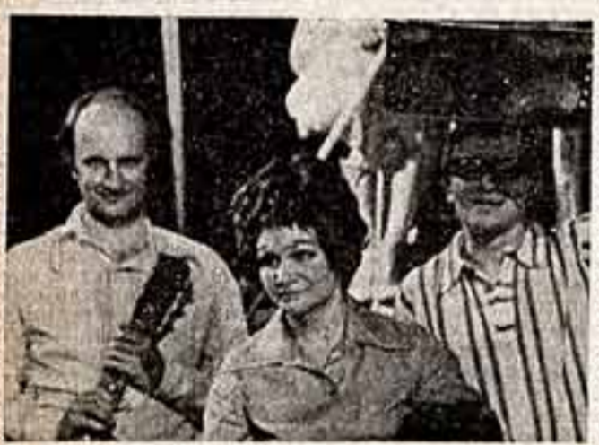
Сцена из спектакля «Тяжелый приз».