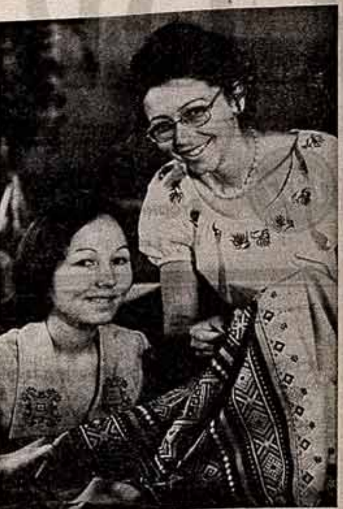
Мариш издается украшают художественными узорами посуду, коврики, одежду. Искусство национального орнамента развивается в изделиях фабрики «Трудовая»...