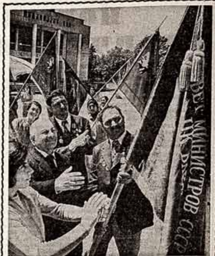
Десять Красных знамен вручен колхозу имени Шумякина Невтечалского района Азербайджана за высокие производственные показатели.