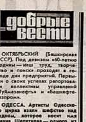
ОКТАБРСКИЙ (Башкирская АССР). Под девизом «60-летие Родины — наш труд, творчество и поиски...

И потому они — его хозяева. В. ТИТОВ, наш спец. корр. Советск, Калининградская область.