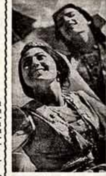
Оверженные — так называют участников трудового подвига.