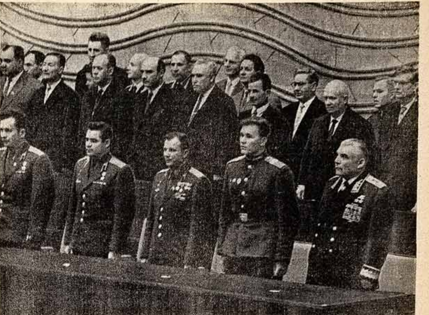
18 ОКТЯБРЯ 1962 ГОДА. Кремлевский Дворец съездов. В президиуме торжественного собрания, посвященного 150-летию Отечественной войны 1812 года.

Сейчас на объектах начала в области работает около 100 библиотек, имеют районные библиотеки, десятки клубов и сотни кружков «самодельности».